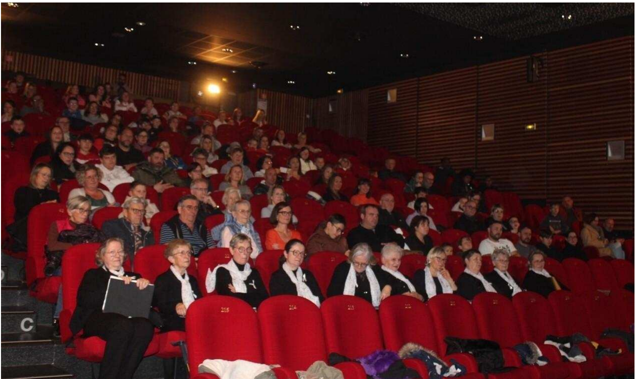
La chorale des enfants a fait le plein de spectateurs et d'émotion. FS