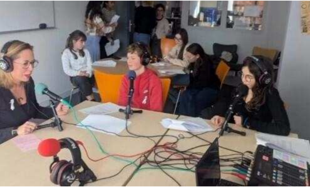
Les collégiens du club média ont consacré une émission de radio aux violences faites aux femmes.