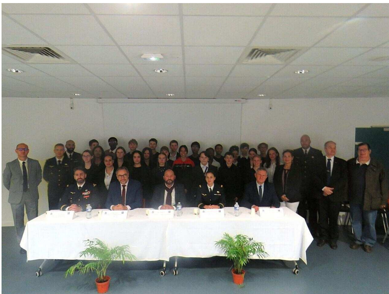
Les signataires de la convention de la classe Défense et sécurité globale et les élèves de 3e du collège Rosa-Parks des Andelys (Eure).

L' Eure compte une 7e classe Défense. La dernière a ouvert au collège Rosa-Parks des Andelys ( Eure ). Une convention a été signée avec la Base aérienne 105 en octobre 2025.