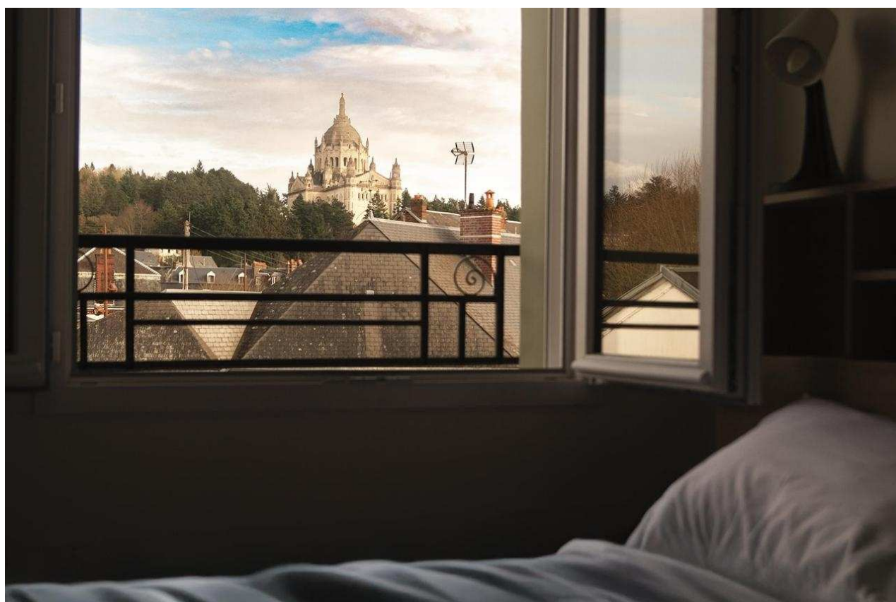
Certaines chambres profitent d'une vue magnifique sur la basilique. Résidence Cosy