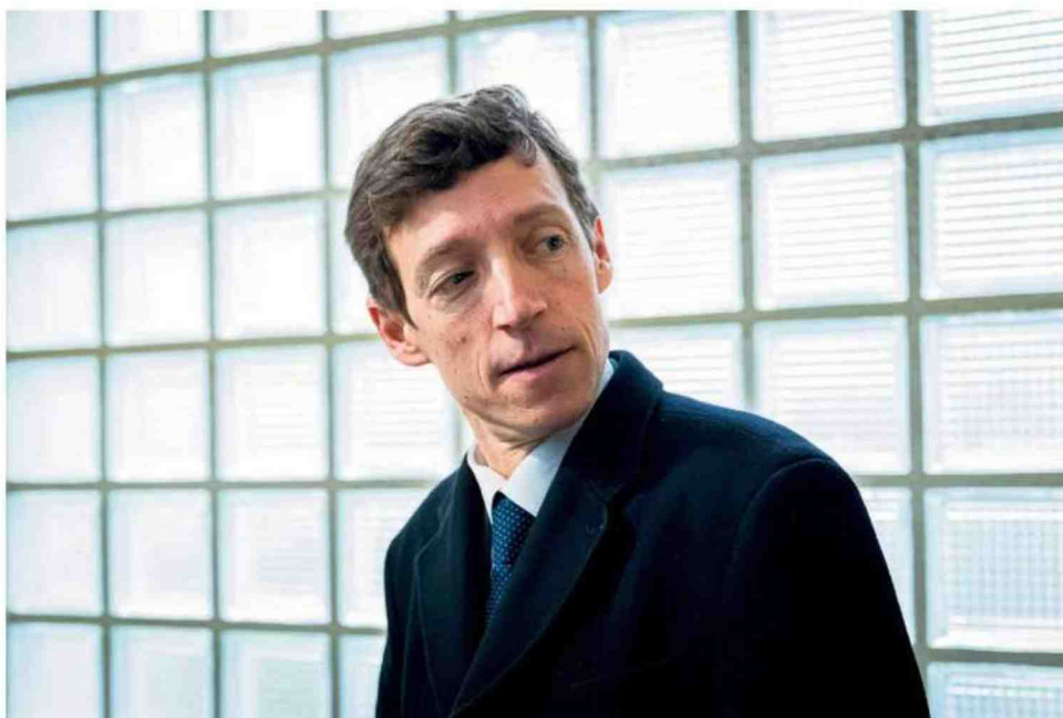
Edouard Geffray, ministre de l'éducation nationale, à Paris, le 7 novembre.