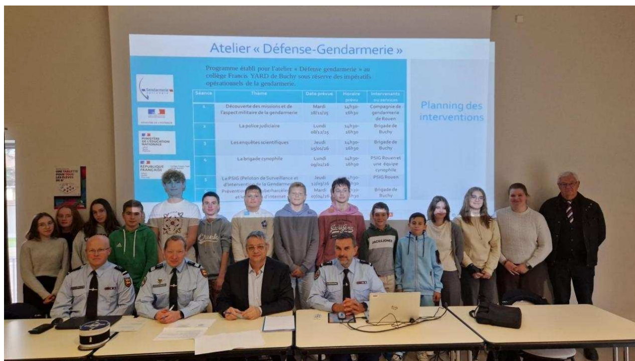
Une vingtaine d'élèves du collège de Buchy vont participer à l'atelier Défense gendarmerie.