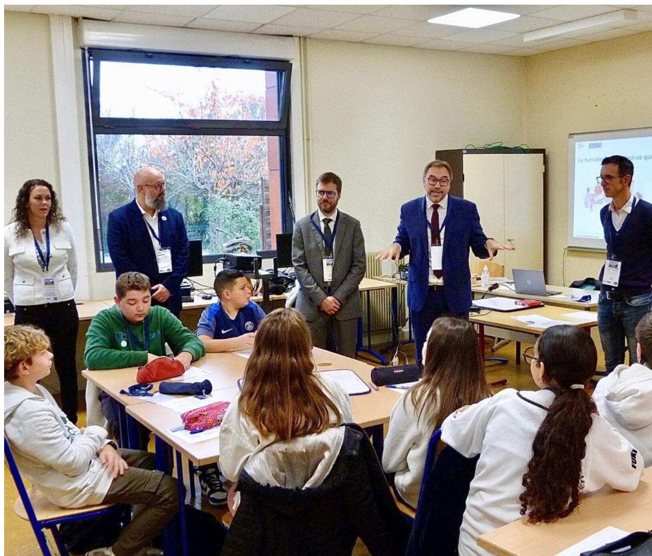
Le collège Marc-Chagall s'engage contre le harcèlement scolaire.

Ainsi le Safer Internet Day, rendez-vous annuel de sensibilisation aux usages du numérique à destination des jeunes et de leur famille, qui vise à encourager les comportements responsables en ligne. Dans le cadre de cette journée, deux professeurs ont réalisé avec les élèves une fresque murale sur le thème de la vigilance.