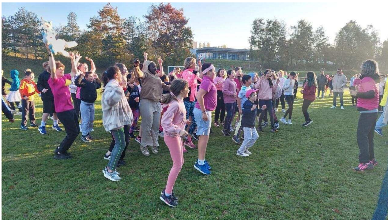
Séance d'échauffement avant le départ.