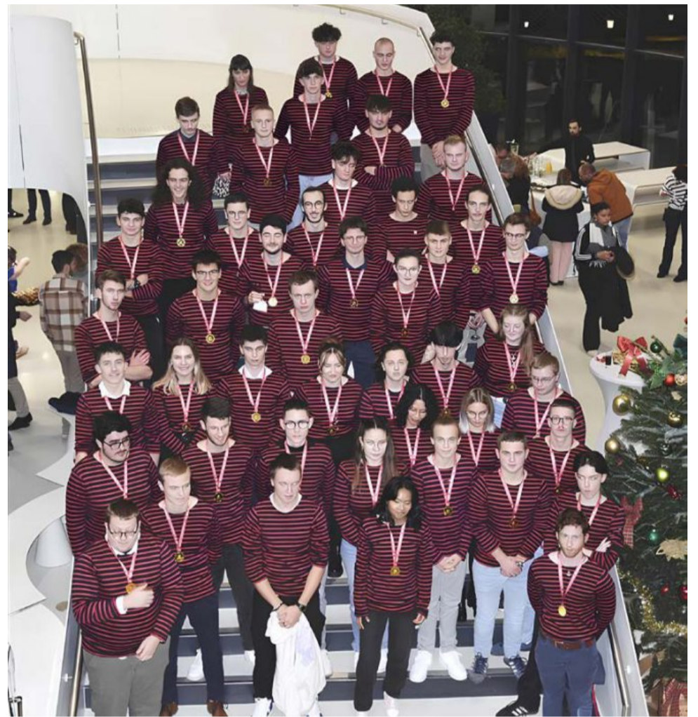
La sélection de Normandie pour les Worldskills 2025 qui se déroulent cette semaine à Marseille.