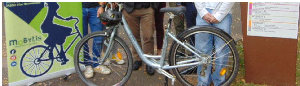
Mobyliis et l'équipe pédagogique du lycée après la signature.