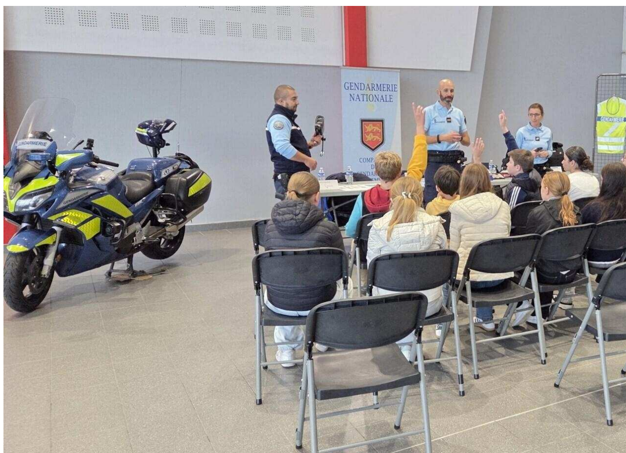
Les gendarmes intervenaient lors du forum sécurité routière Ancrage

L'Ancrage organisait vendredi 3 octobre 2025 un forum de la sécurité routière au Tréport . L'occasion pour les collégiens et tous les habitants d'adopter de bonnes habitudes.