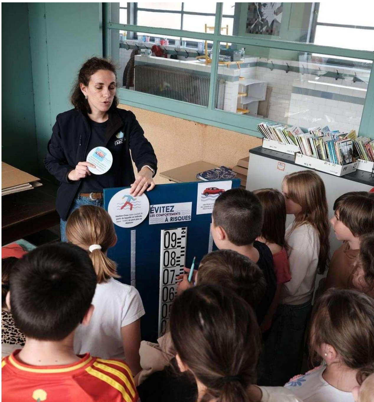
L'apprentissage par le jeu. SBVEA