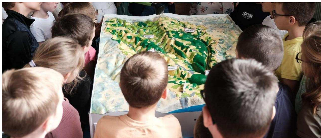
L'apprentissage par le jeu, une manière sympathique de sensibiliser les enfants aux inondations. SBVEA