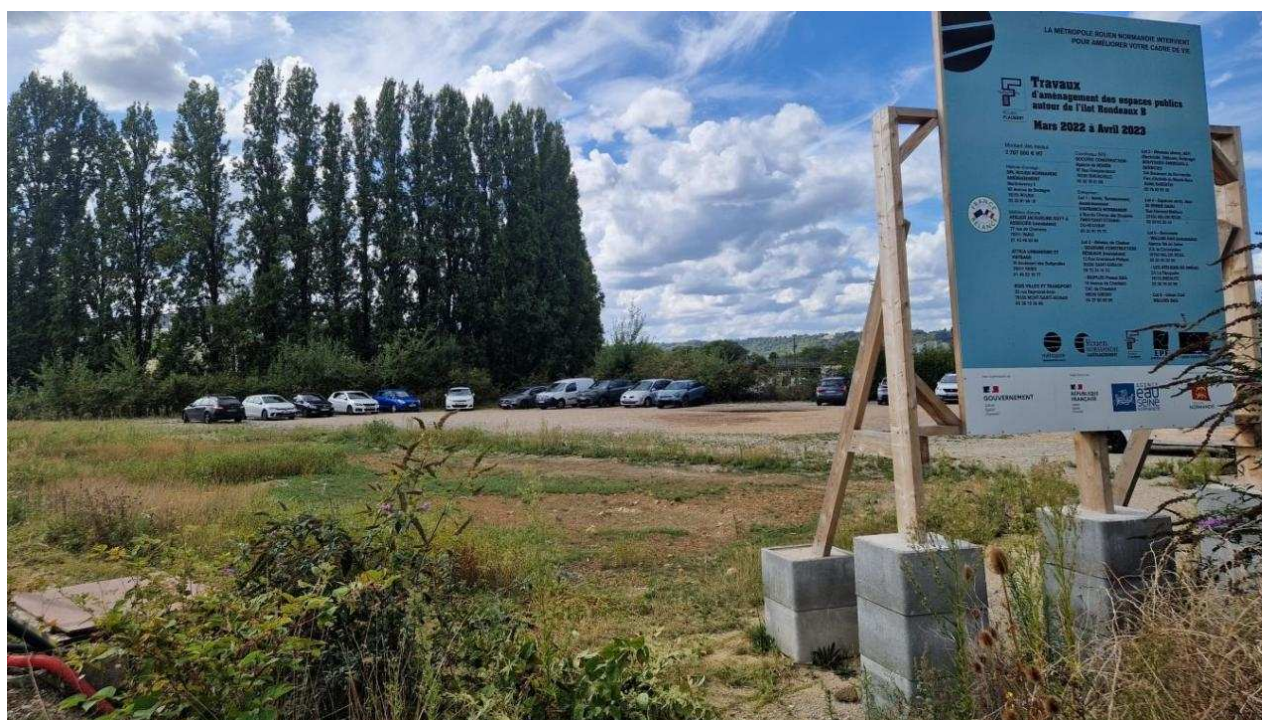
Le futur groupe scolaire du quartier Flaubert devrait ouvrir en 2029.