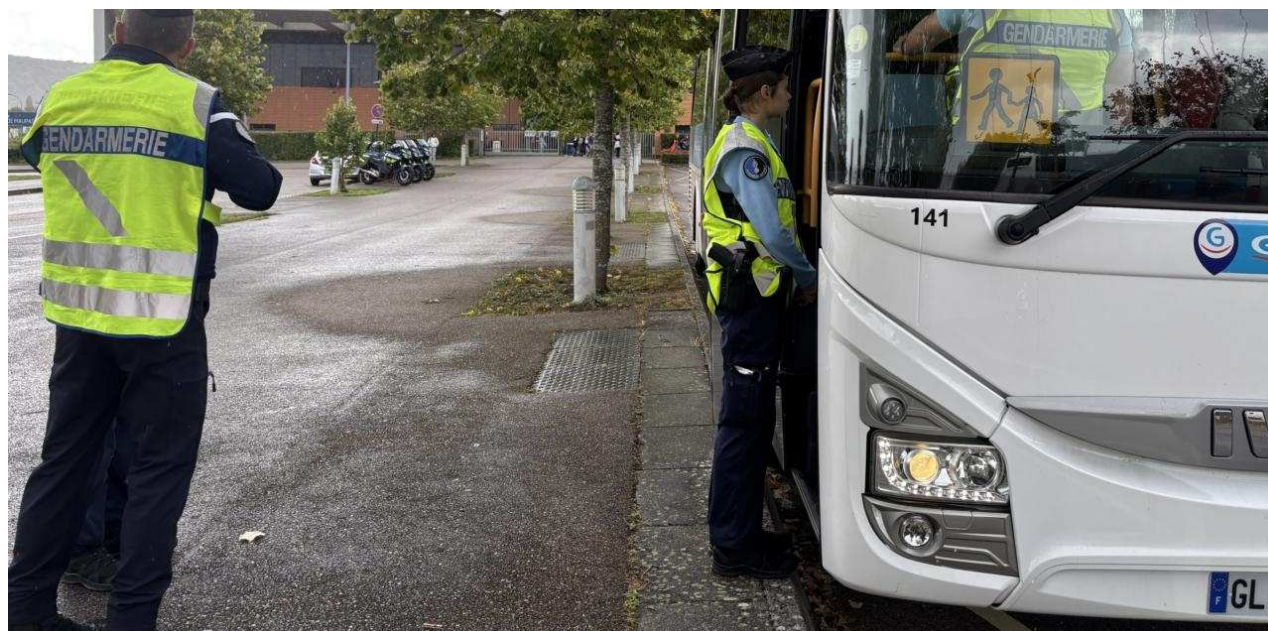
Les gendarmes ont contrôlé les transports scolaires jeudi 4 septembre devant le collège de Fleury-sur-Andelle.