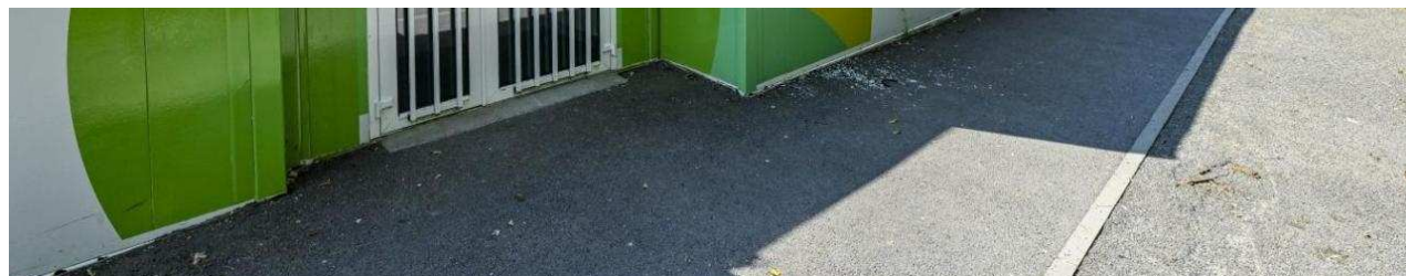
Le collège provisoire avait été installé juste à côté du dojo, à Goderville.