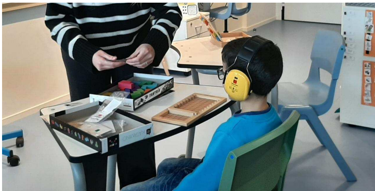
Deux AESH accompagnent chaque jour les élèves de l'UEEA de l'école Victor Hugo.