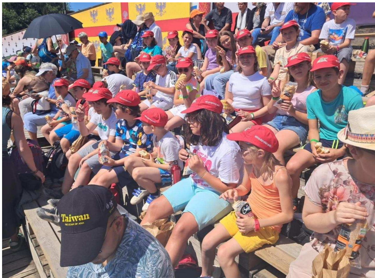
Un petit moment de pose en attendant le prochain spectacle Equipe de la Barre-en-Ouche