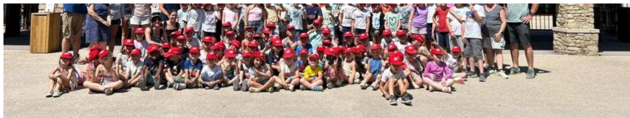
Pas moins de 125 élèves et 21 accompagnateurs au Puy du Fou. Equipe de la Barre-en-Ouche