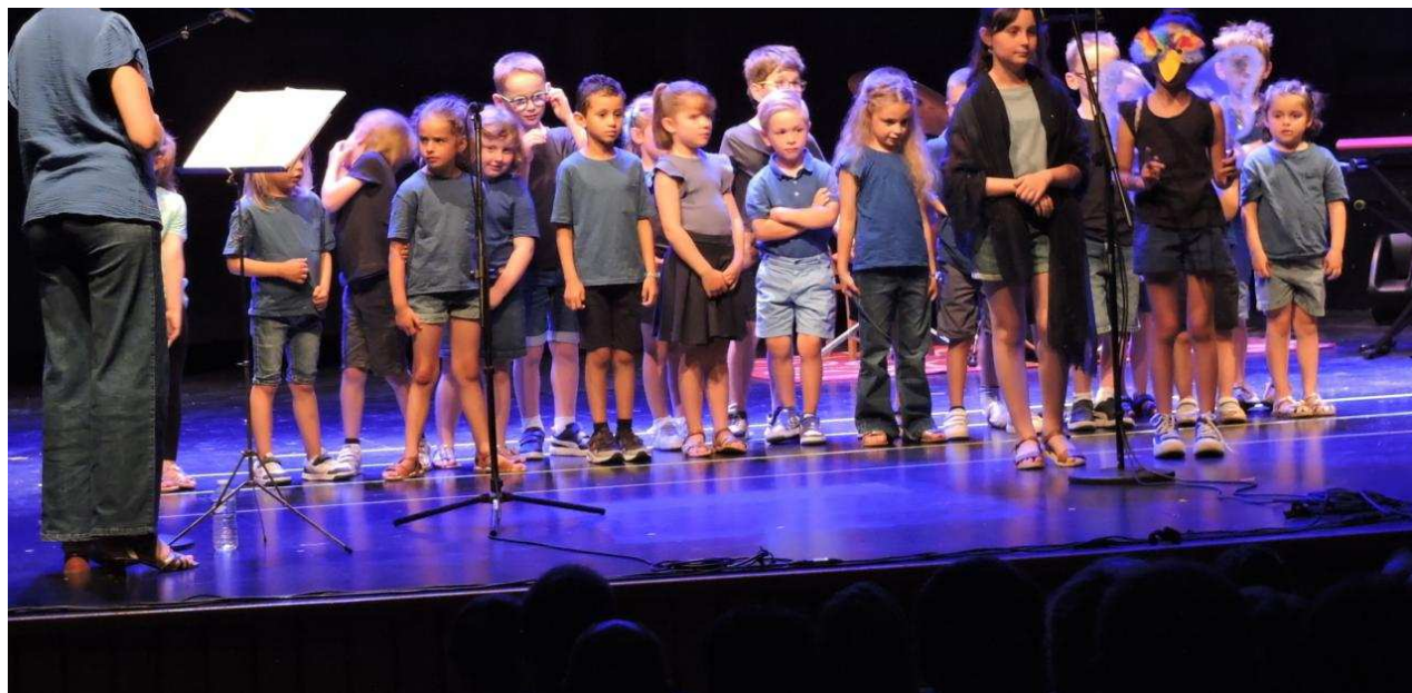
Les enfants chantent l'histoire de la goutte d'eau Cléo.