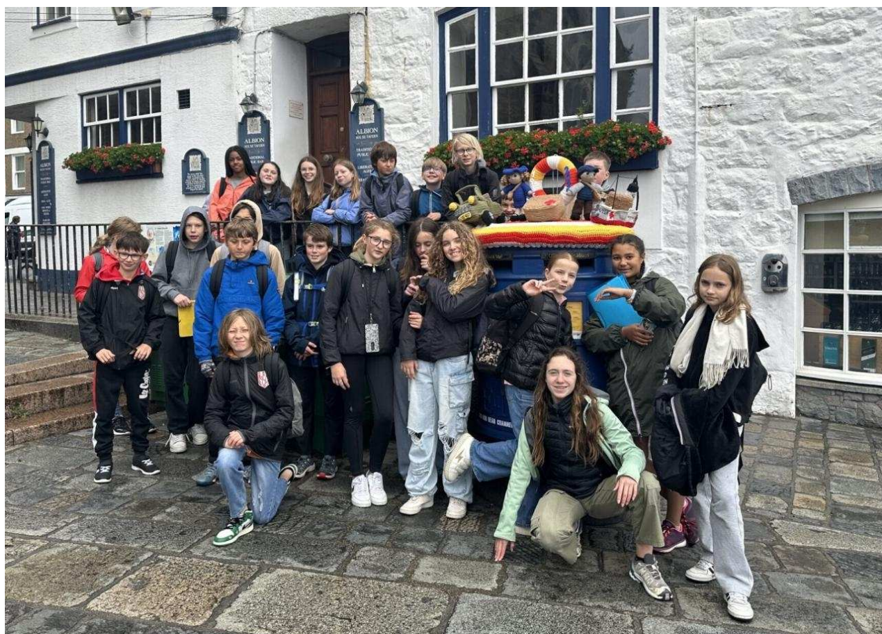
La classe de 5e D devant The Albion House Tavern.

Entre histoire, pratique de l'anglais, gastronomie locale et découvertes culturelles, ces journées ont laissé de beaux souvenirs aux élèves, tout en enrichissant leurs apprentissages. Un projet réussi grâce à l'implication des équipes pédagogiques et à l'enthousiasme des collégiens.