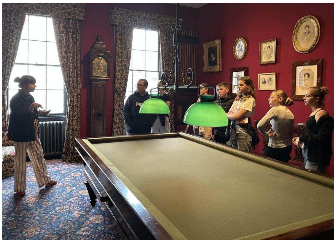
La classe de 5e E dans la maison de Victor Hugo.