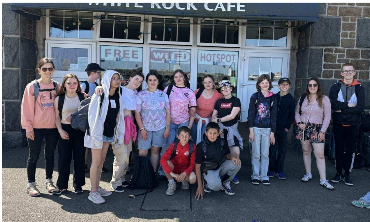
La classe de 5e SEGPA devant le White Rock Cafe.