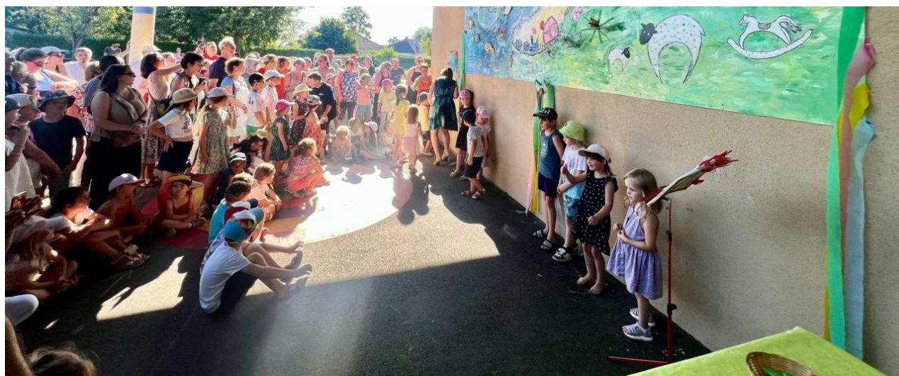
Ce sont les enfants qui ont coupé les rubans. Le Bulletin