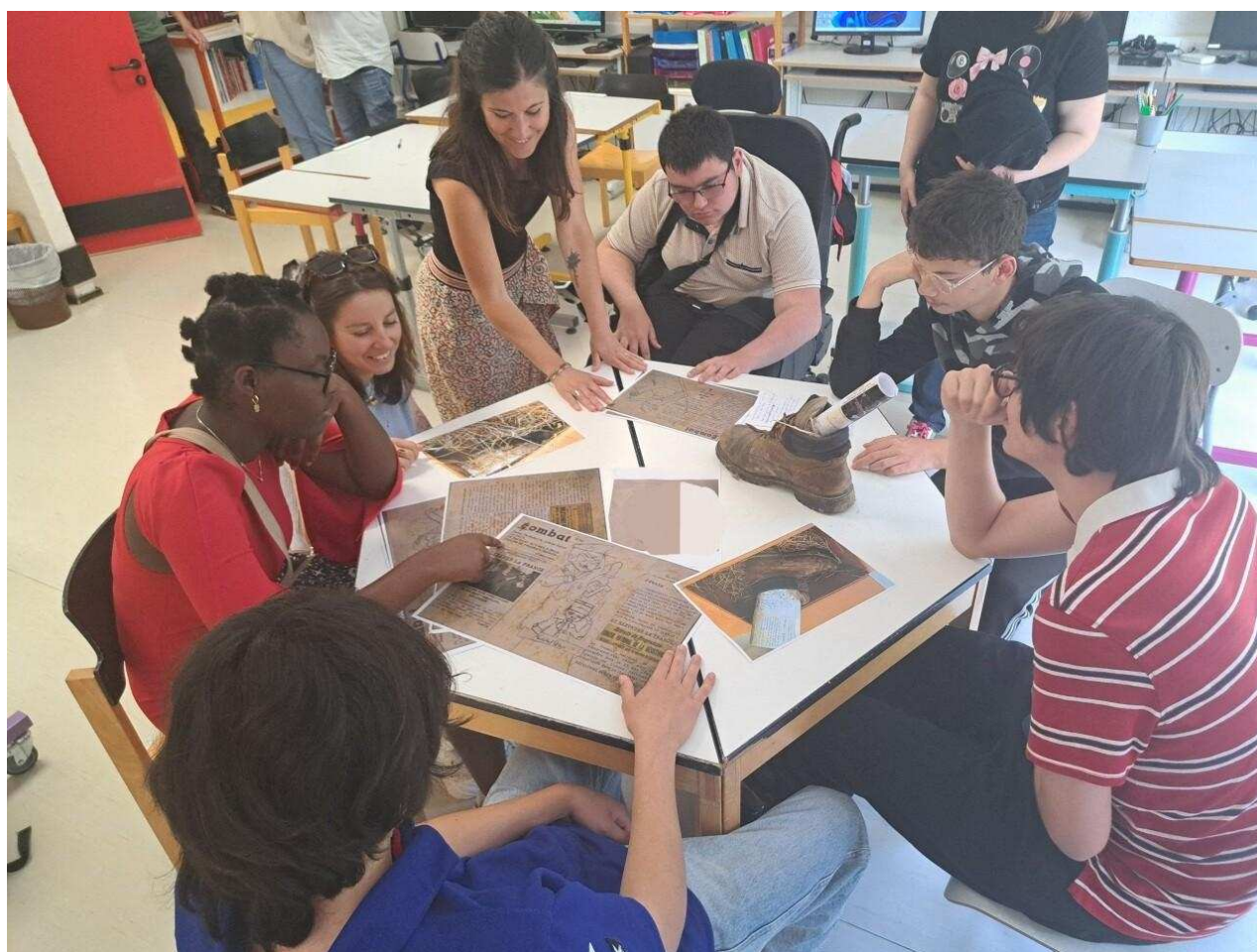
Les élèves de l'IEM autour de leurs projets.

Neuf élèves de l'Institut d'Éducation Motrice (IEM) d' Hérouville Saint-Clair ( Calvados ) ont planché sur le concours national de la Résistance et de la Déportation.