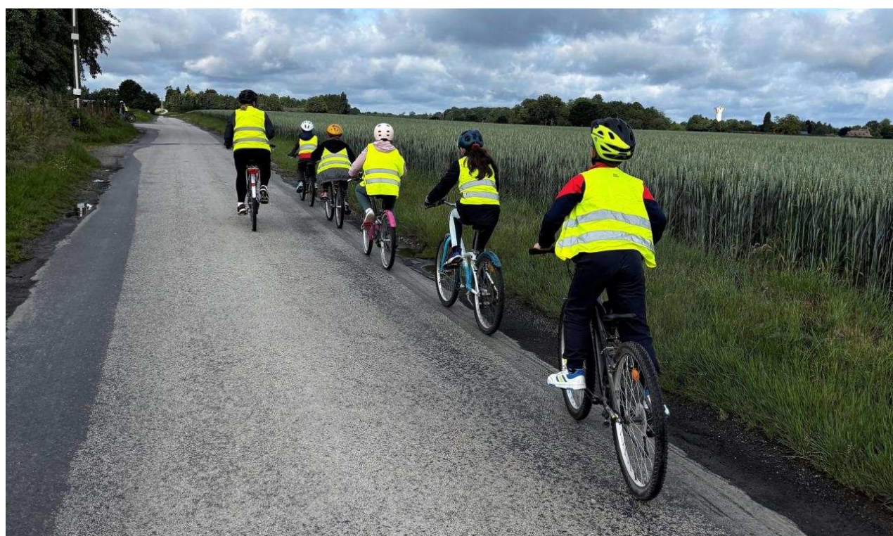
Une sortie à vélo, par groupe de cinq avec un adulte accompagnateur E.E.P.