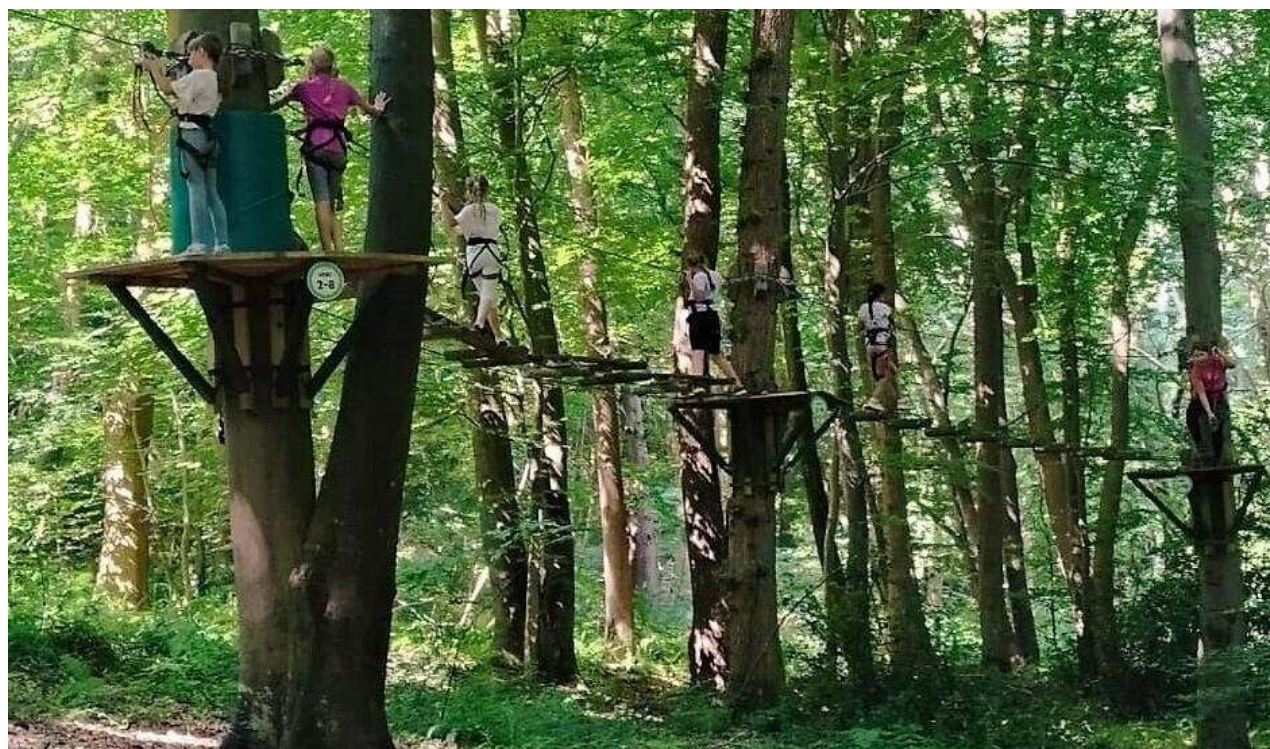
S'accrocher aux branches, pas si simple E.E.P.