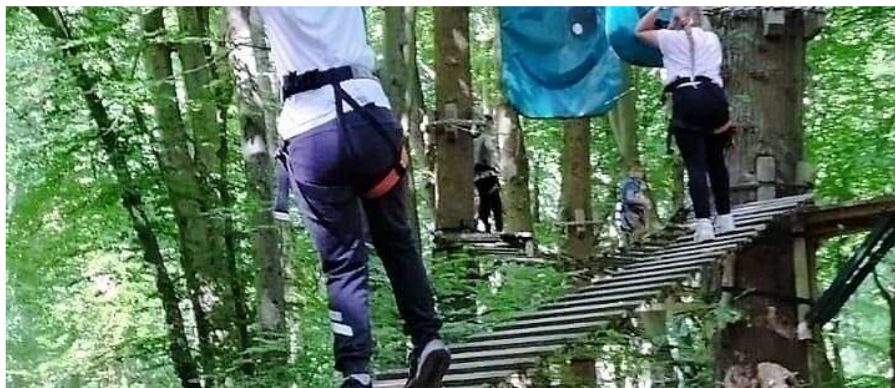
Des exercices périlleux. E.E.P.