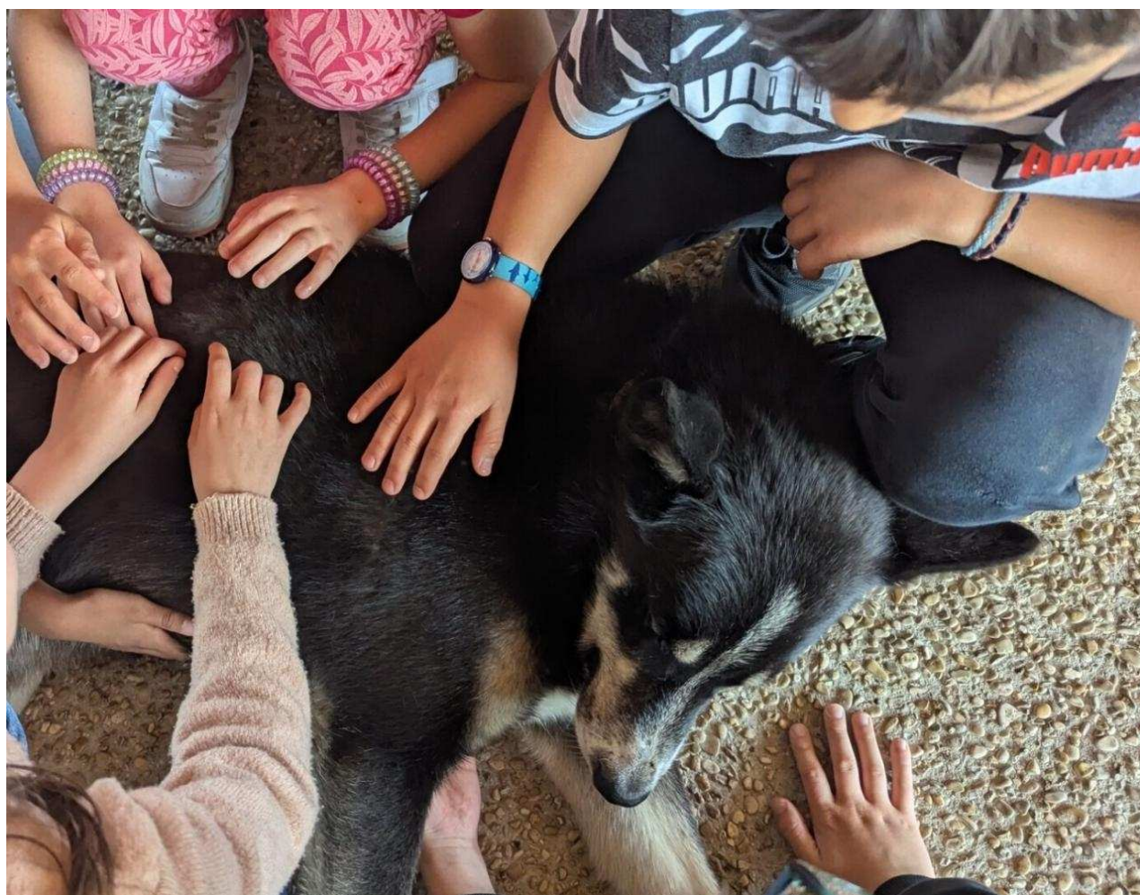
Les chiens du musher se sont ravis de tant d'attention.