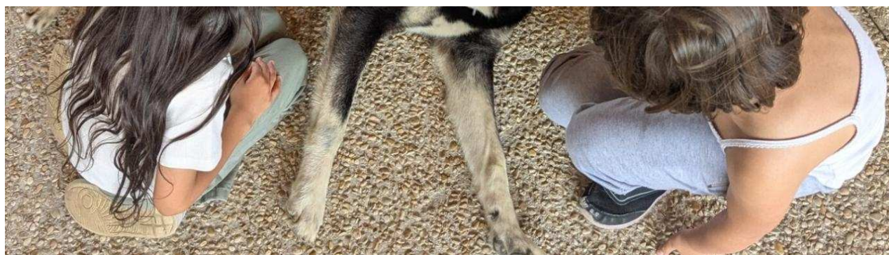
19 chiens de traîneau ont séjourné dans la cour, pour leur plus grand bonheur et celui des élèves. Ville de Saint-Pierre-lès-Elbeuf