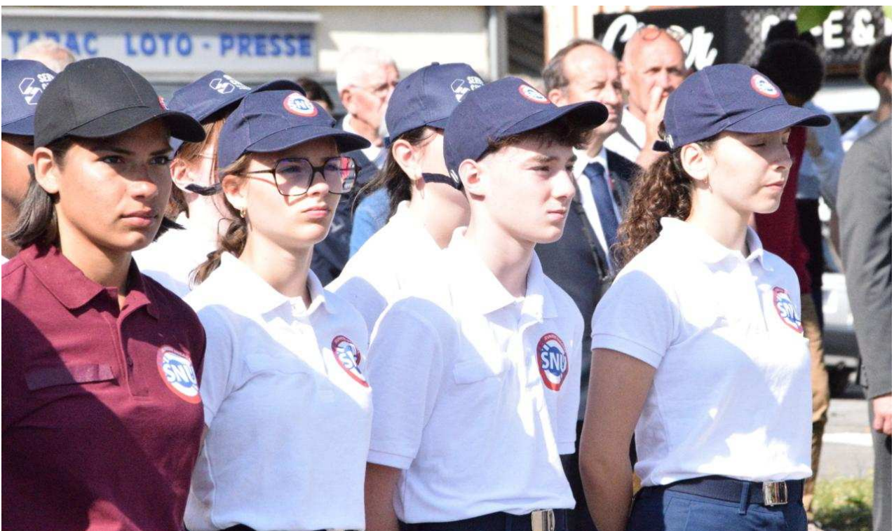
124 Normands engagés dans le SNU ont assisté au 85e anniversaire de l'Appel du 18-Juin.