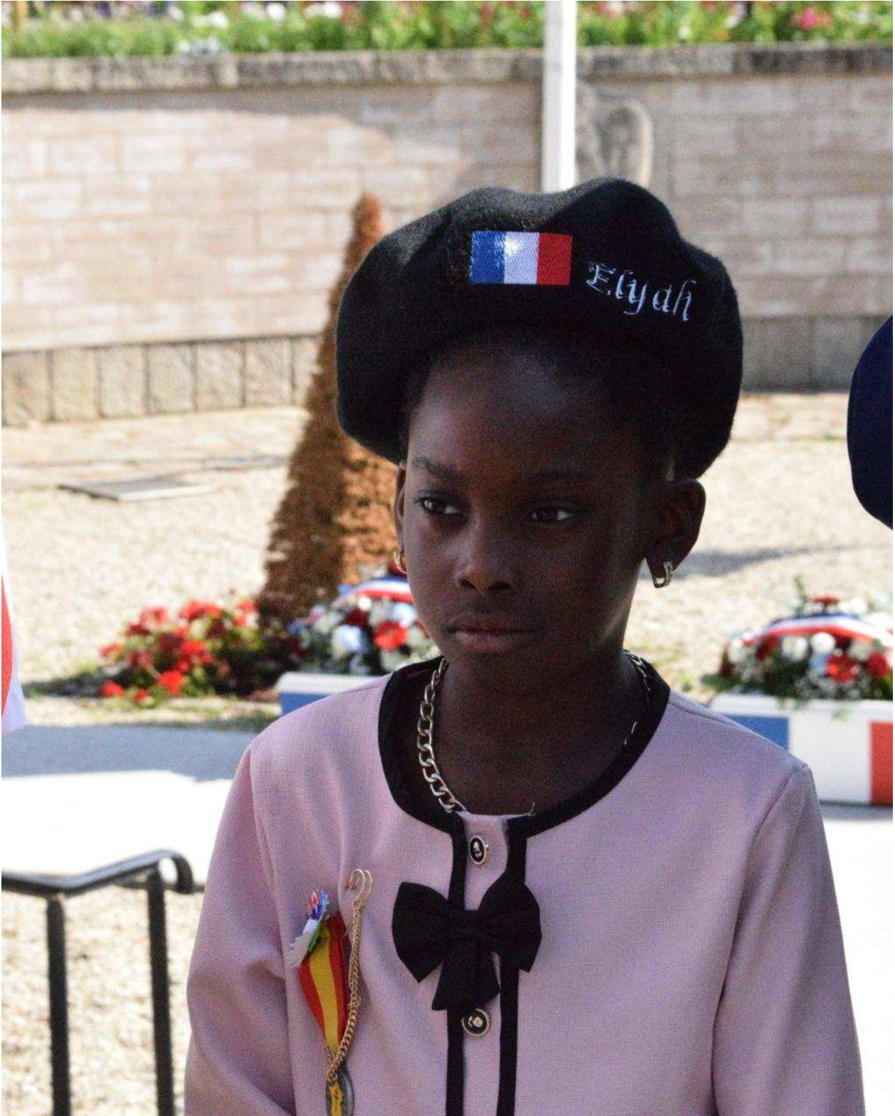
L'Orne hebdo L'Orne hebdo