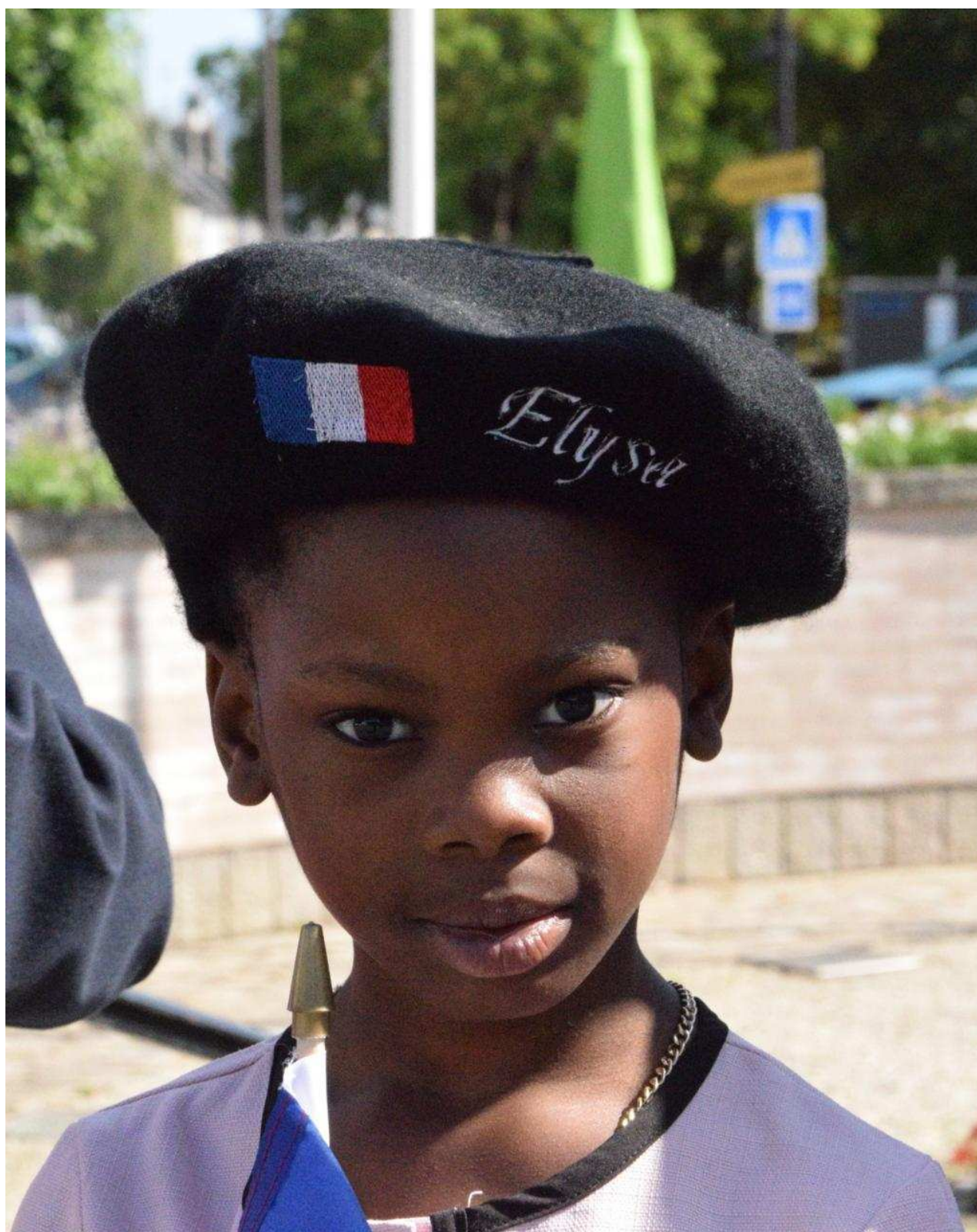
L'Orne hebdo L'Orne hebdo