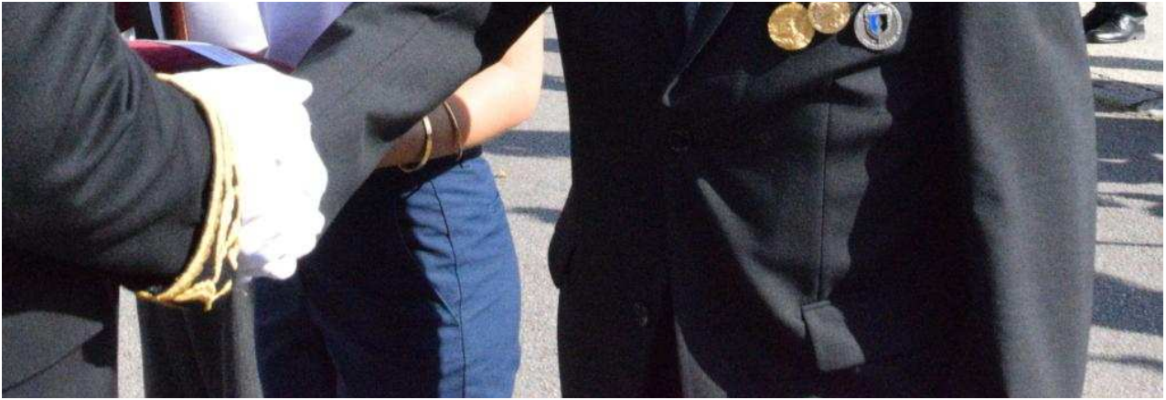
Dernière cérémonie patriotique pour le préfet Sébastien Jallet, ce 18 juin 2025, dans l'Orne avant de gagner la Sarthe où il est nommé à compter du 30 juin.