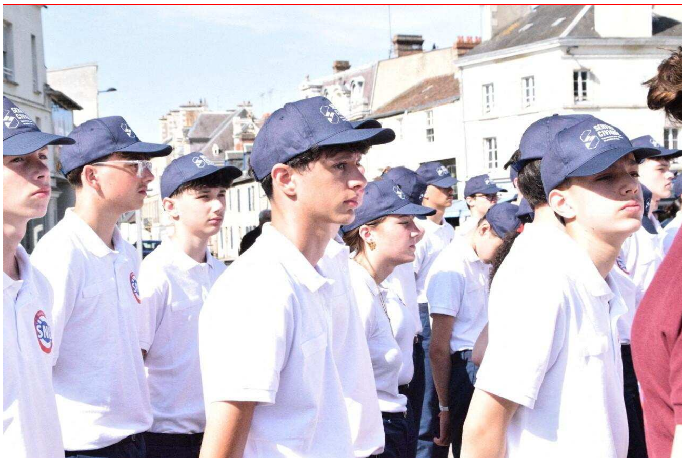
124 Normands effectuent leur SNU à Alençon, du 16 au 27 juin. Le 18 juin, ils ont assisté à la cérémonie commémorative de l'Appel du Général de Gaulle.