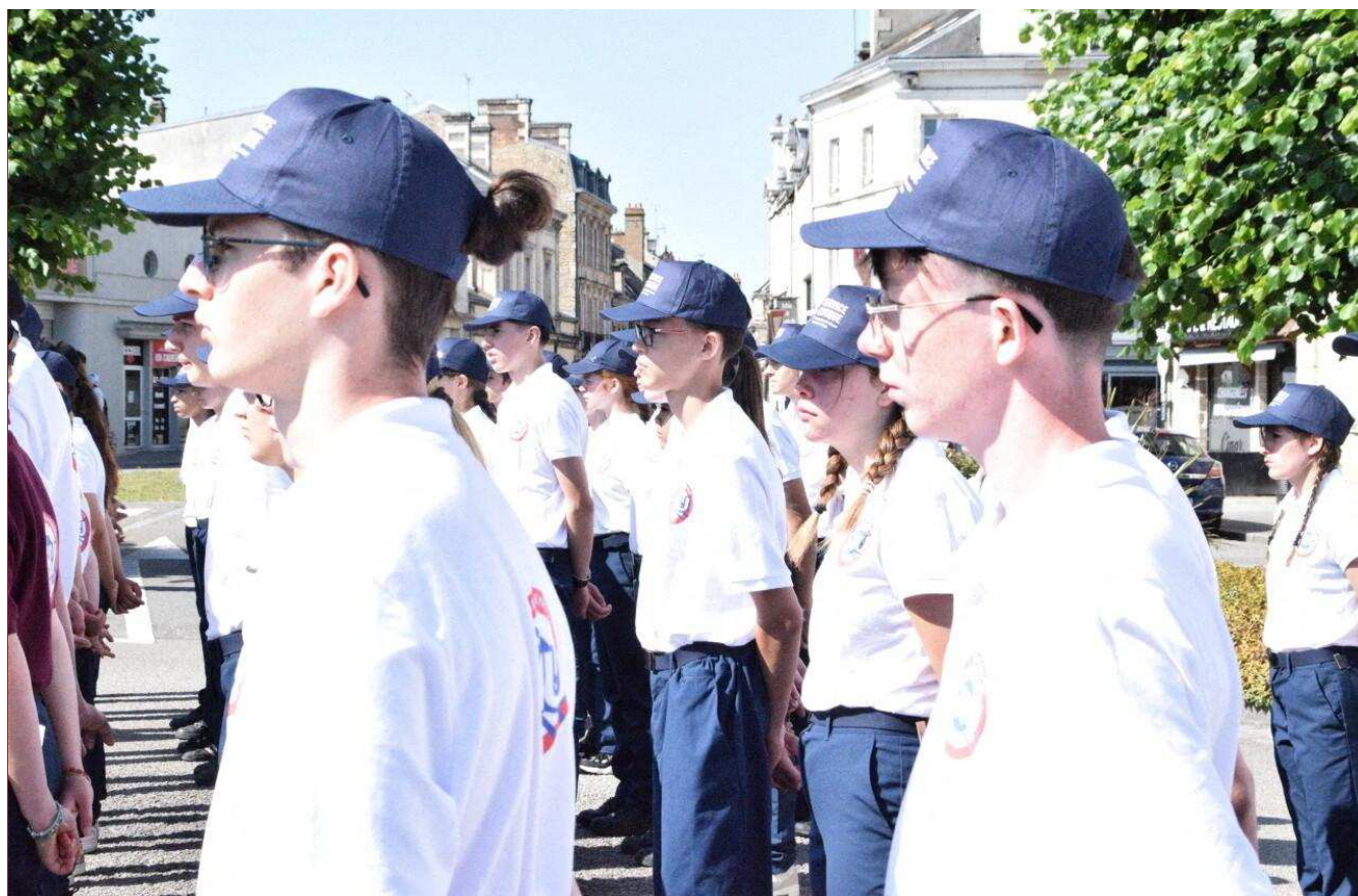
124 Normands effectuent leur SNU à Alençon, du 16 au 27 juin. Le 18 juin, ils ont participé à la cérémonie commémorative de l'Appel du Général de Gaulle.