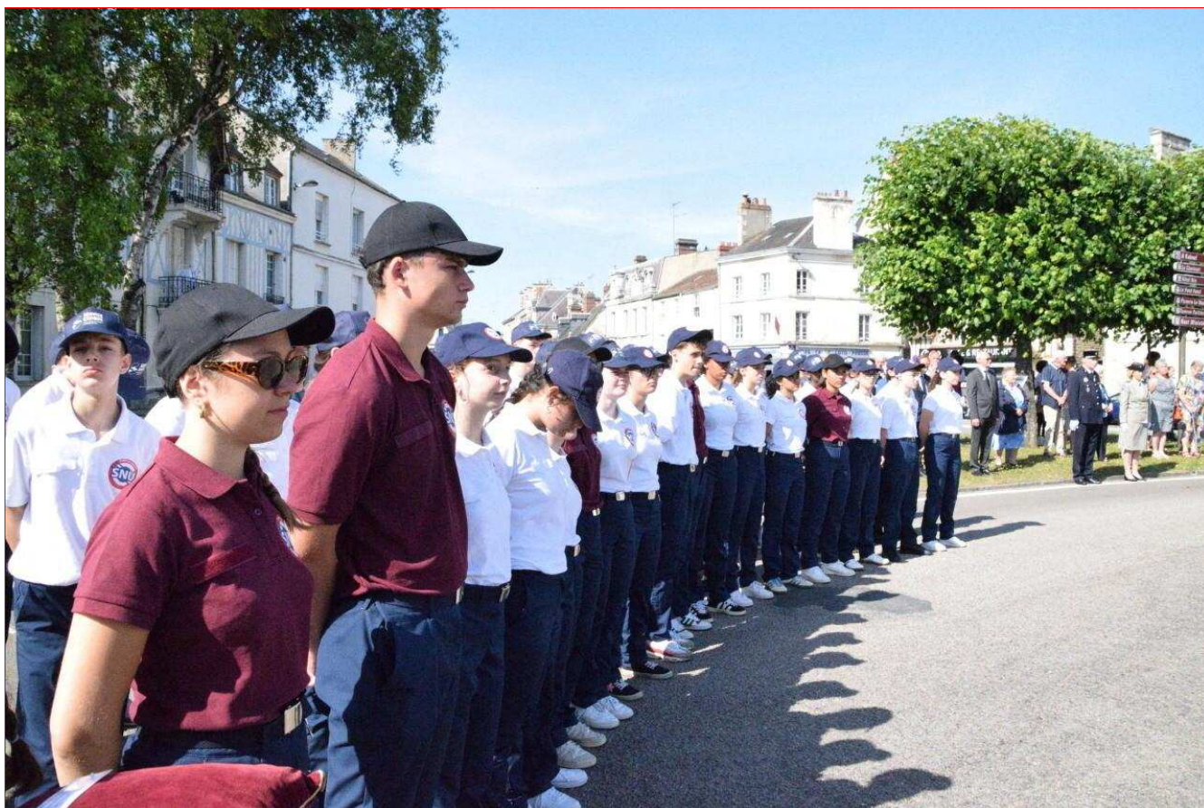
124 Normands effectuent leur SNU à Alençon, du 16 au 27 juin. Le 18 juin, ils ont assisté à la cérémonie commémorative de l'Appel du Général de Gaulle.