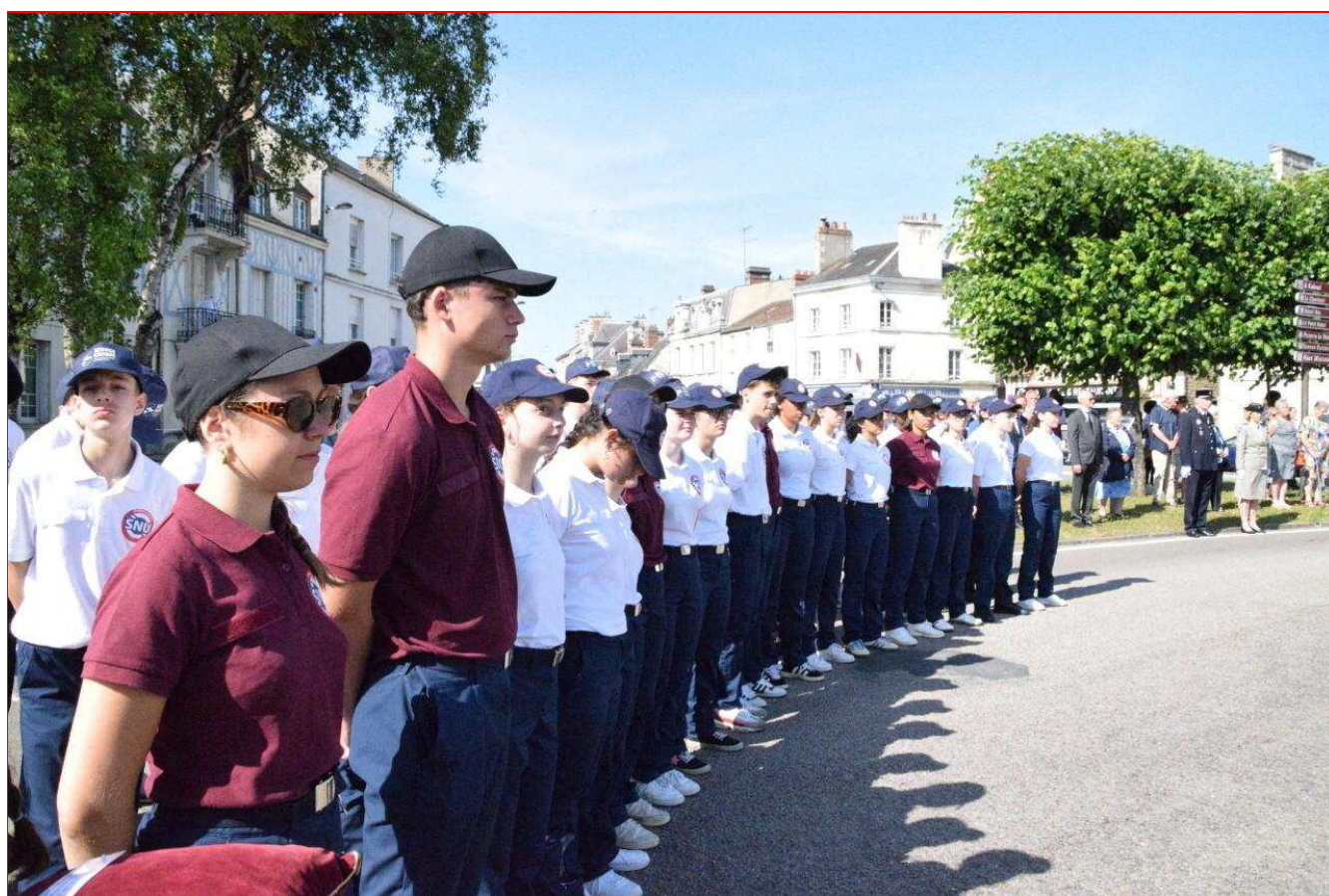
124 Normands effectuent leur SNU à Alençon, du 16 au 27 juin. Le 18 juin, ils ont participé à la cérémonie commémorative de l'Appel du Général de Gaulle.