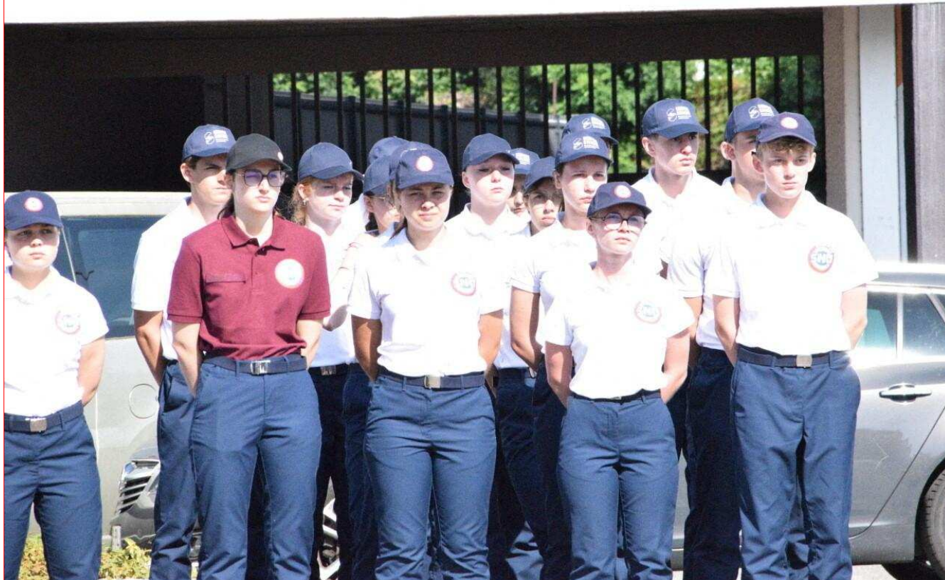
124 Normands effectuent leur SNU à Alençon, du 16 au 27 juin. Le 18 juin, ils ont assisté à la cérémonie commémorative de l'Appel du Général de Gaulle.