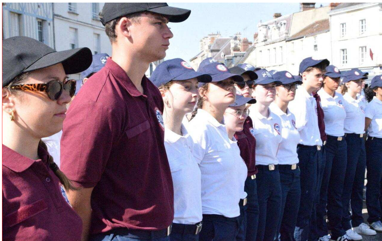
124 Normands effectuent leur SNU à Alençon, du 16 au 27 juin. Le 18 juin, ils ont assisté à la cérémonie commémorative de l'Appel du Général de Gaulle.