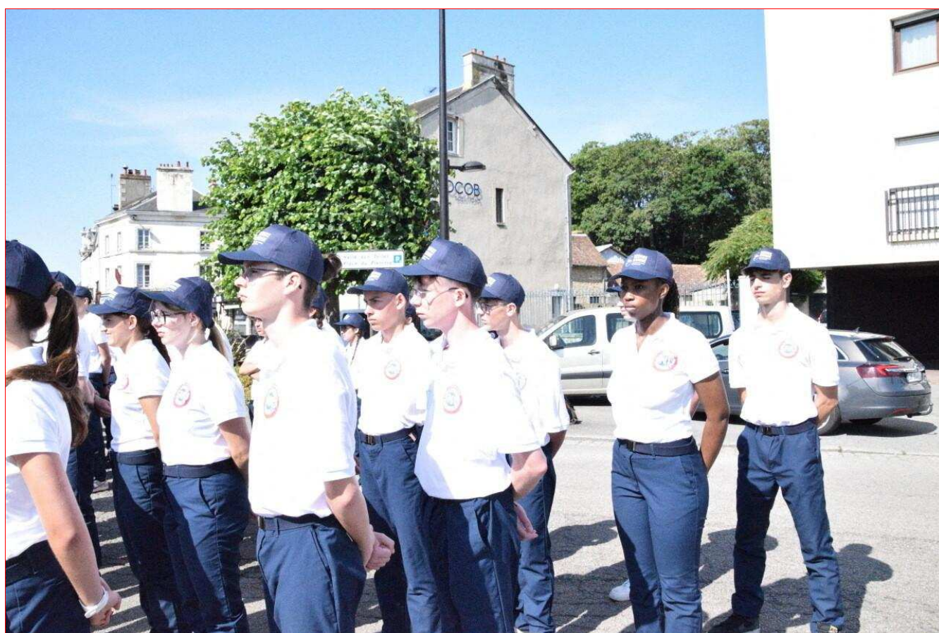
124 Normands effectuent leur SNU à Alençon, du 16 au 27 juin. Le 18 juin, ils ont assisté à la cérémonie commémorative de l'Appel du Général de Gaulle.