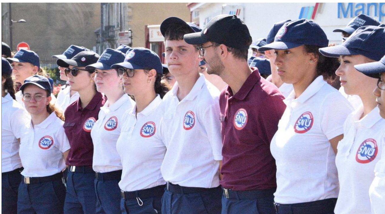
124 Normands effectuent leur SNU à Alençon, du 16 au 27 juin. Le 18 juin, ils ont assisté à la cérémonie commémorative de l'Appel du Général de Gaulle.