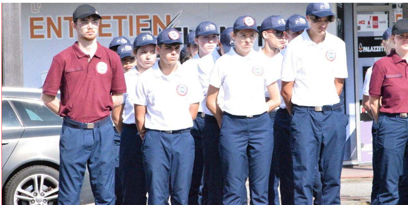
124 Normands effectuent leur SNU à Alençon, du 16 au 27 juin. Le 18 juin, ils ont assisté à la cérémonie commémorative de l'Appel du Général de Gaulle.