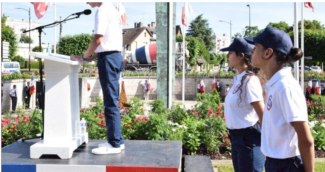
124 Normands effectuent leur SNU à Alençon, du 16 au 27 juin. Le 18 juin, ils ont également assisté à la cérémonie commémorative de l'Appel du Général de Gaulle.