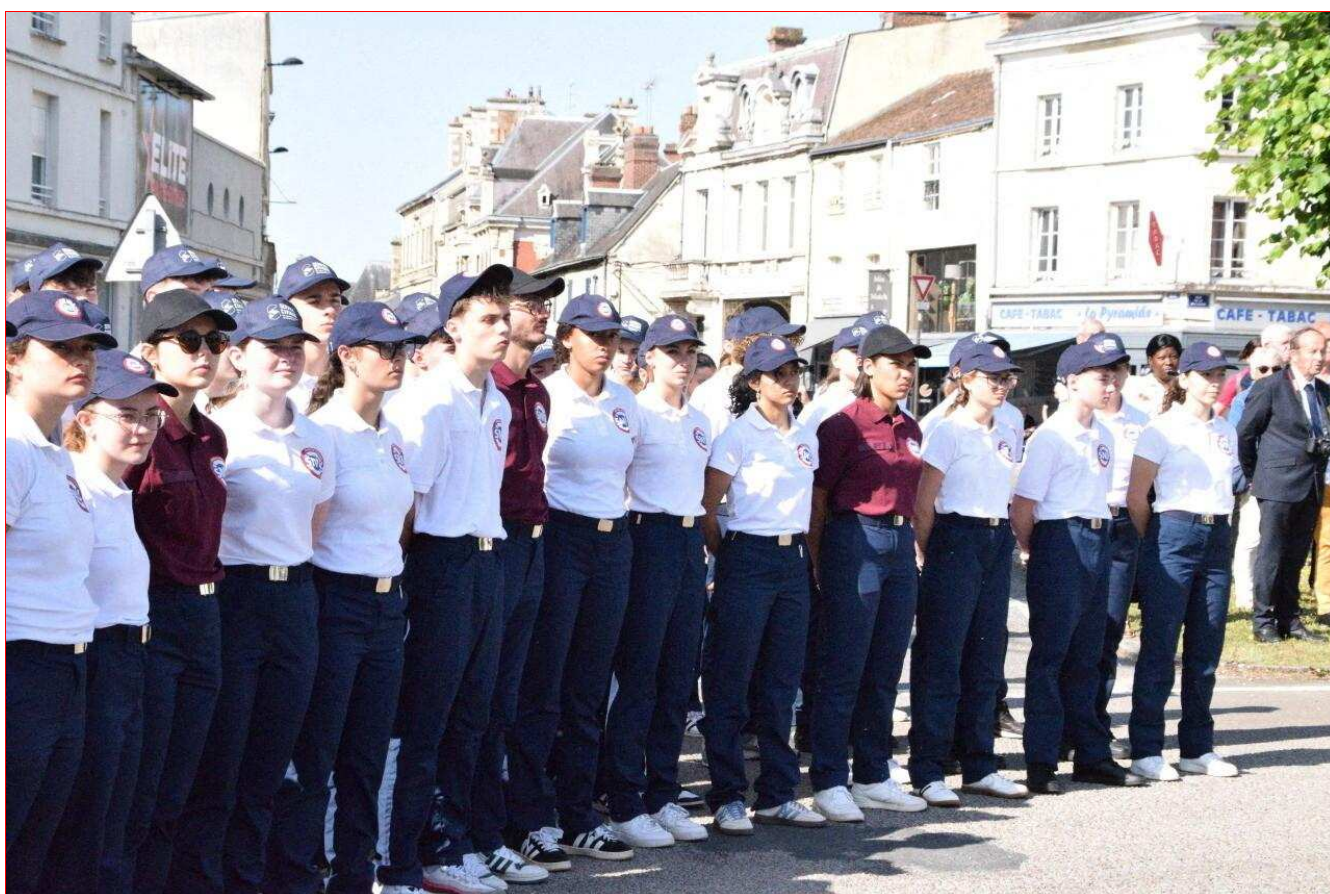
124 Normands effectuent leur SNU à Alençon, du 16 au 27 juin. Le 18 juin, ils ont également assisté à la cérémonie commémorative de l'Appel du Général de Gaulle.