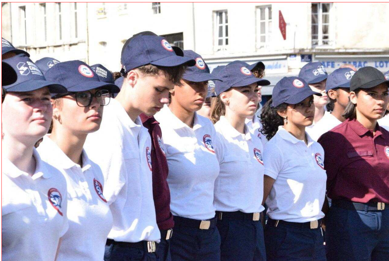
124 Normands effectuent leur SNU à Alençon, du 16 au 27 juin. Le 18 juin, ils ont participé à la cérémonie commémorative de l'Appel du Général de Gaulle.