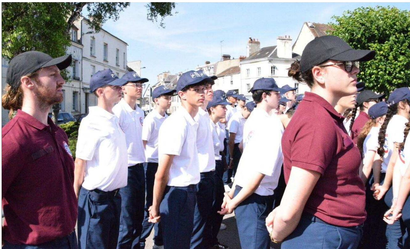
124 Normands effectuent leur SNU à Alençon, du 16 au 27 juin. Le 18 juin, ils ont participé à la cérémonie commémorative de l'Appel du Général de Gaulle.