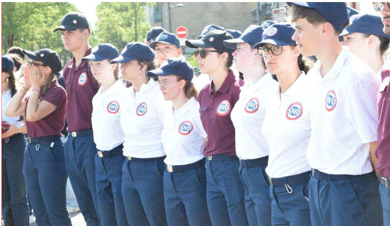
124 Normands effectuent leur SNU à Alençon, du 16 au 27 juin. Le 18 juin, ils ont assisté à la cérémonie commémorative de l'Appel du Général de Gaulle.