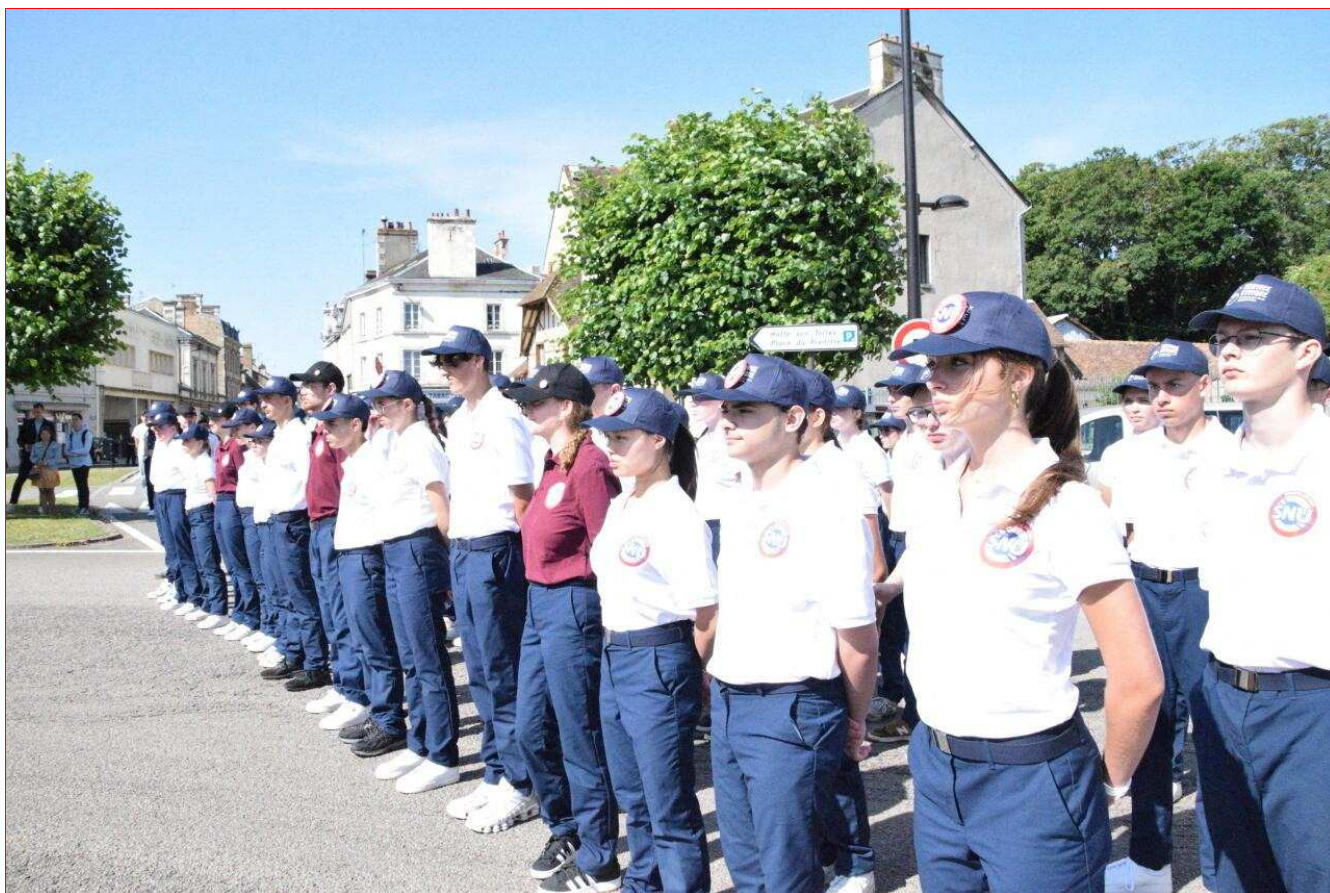
124 Normands effectuent leur SNU à Alençon, du 16 au 27 juin. Le 18 juin, ils ont assisté à la cérémonie commémorative de l'Appel du Général de Gaulle.