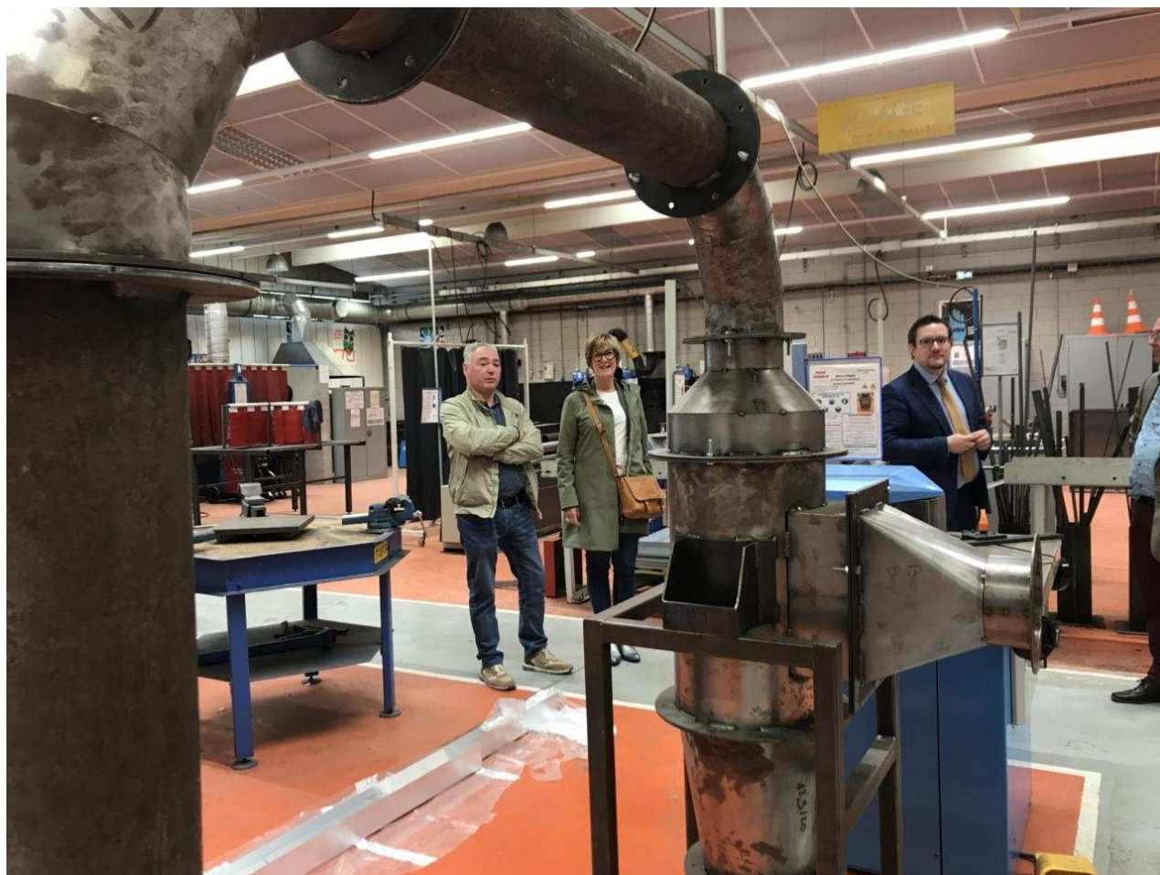
Céline Brulin, sénatrice, découvre les réalisations des élèves en chaudronnerie Le Réveil