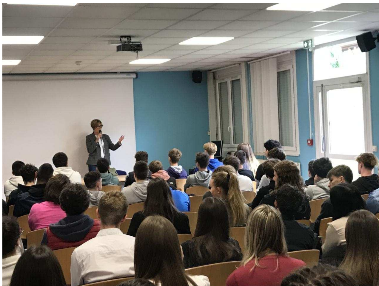
Céline Brulin, sénatrice, a répondu aux nombreuses questions des lycéens Le Réveil