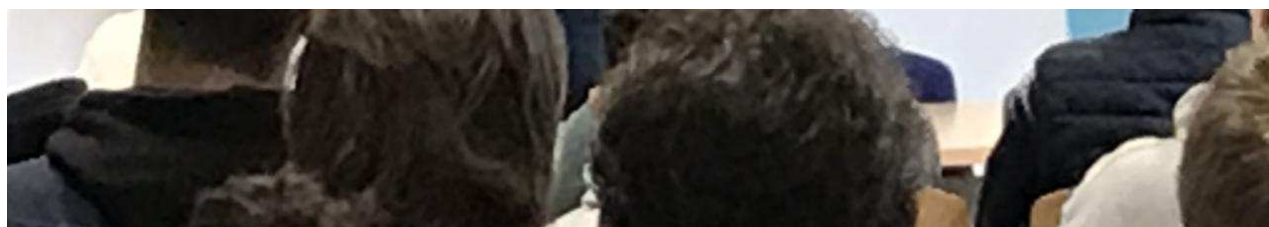
Céline Brulin, sénatrice, explique son mandat d'élue.