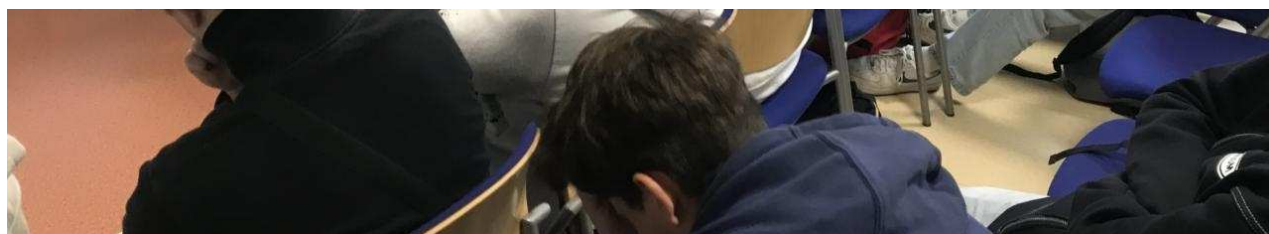
Céline Brulin, sénatrice, a répondu aux nombreuses questions des lycéens Le Réveil