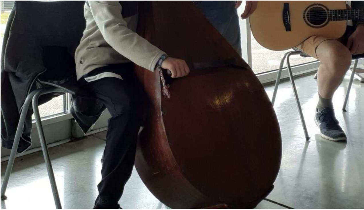
Certains ont la chance de manier des instruments de grande taille.