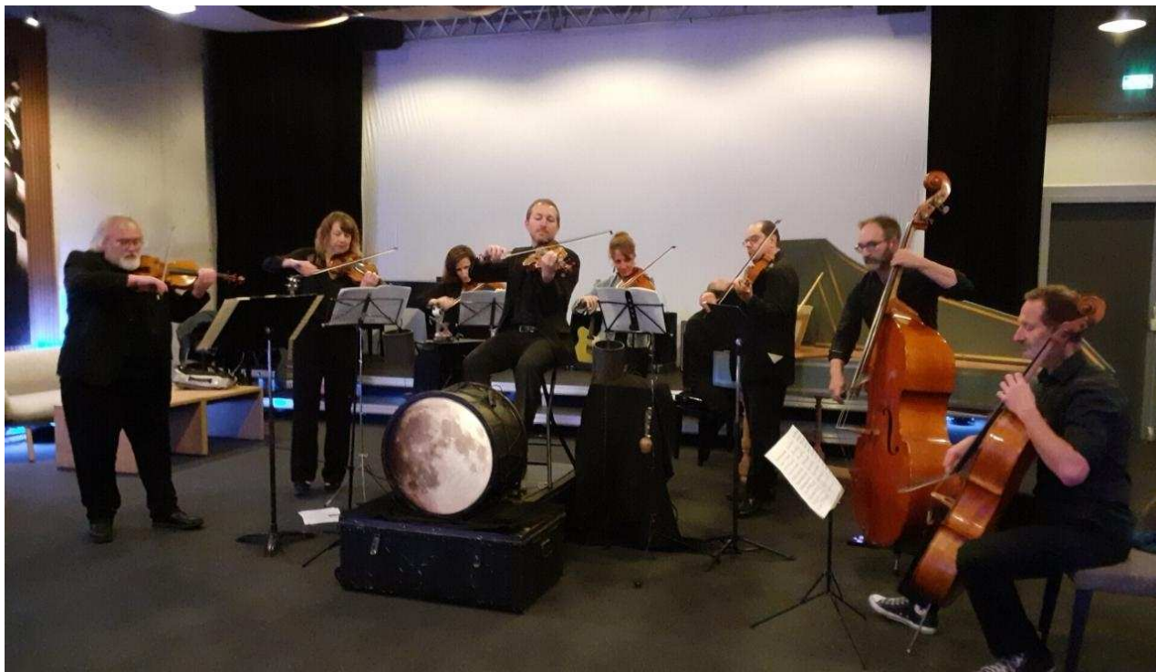
L'ensemble des musiciens dans le Salon VIP avec la famille à cordes et le clavecin pour la découverte des 4 saisons de Vivaldi.