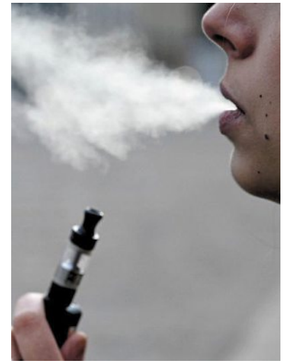
Le vapotage s'est fait une place devant les lycées de Saint-Lô, mais la question de son interdiction via la loi du 1 er juillet reste floue.

Les lycéens s'interrogent en revanche sur ce qu'il adviendra des vapo-teurs, ce à quoi il est difficile de