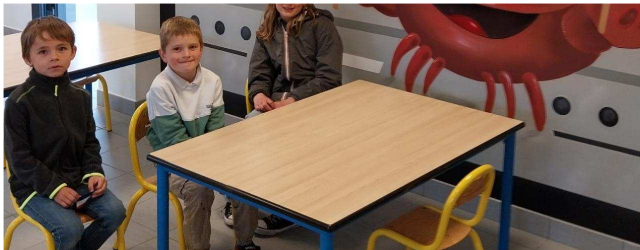
La fresque représentant un crabe cuisinier plait aux enfants installés dans la salle de restauration. Jean-Jacques BACSYNSKI