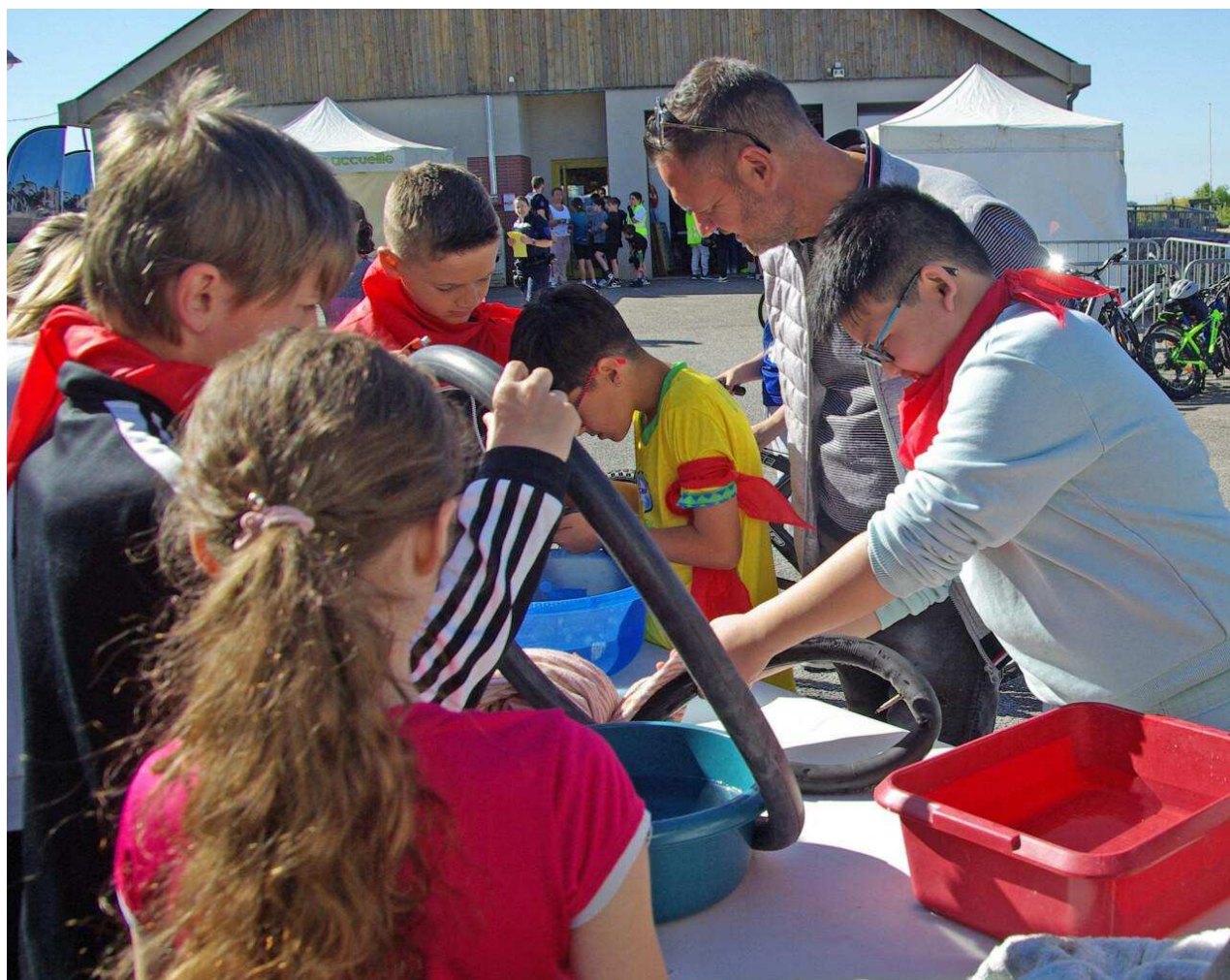
Trouver et réparer une fuite sur la chambre à air : tel était le but du passage sur le stand de Doct'Eure Vélo.