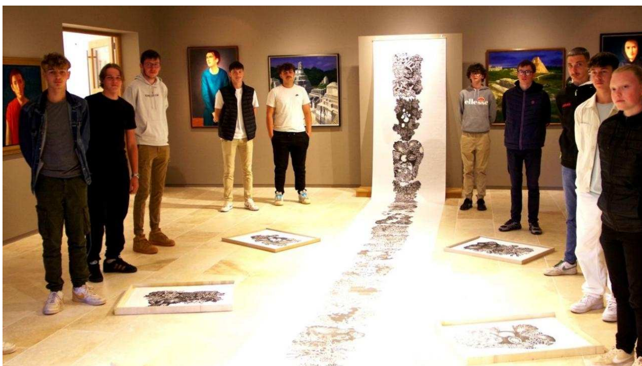
Les élèves devant leurs créations

« Sur le pont » n'est pas seulement une œuvre plastique : c'est aussi un projet interdisciplinaire, ouvert et solidaire. Pour mettre en valeur chaque gravure, des boîtes en bois ont été fabriquées sur mesure pour y glisser chacun des 20 dessins réalisés par les lycéens.