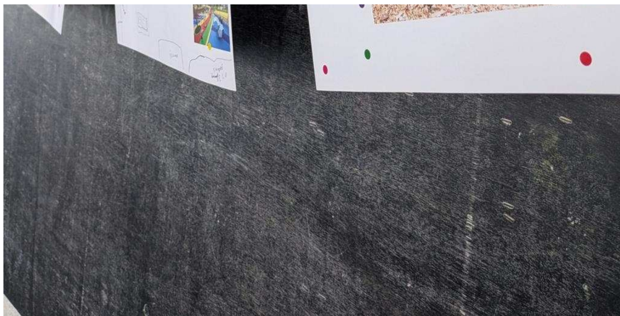
Les idées des enfants, comme une classe en extérieure.