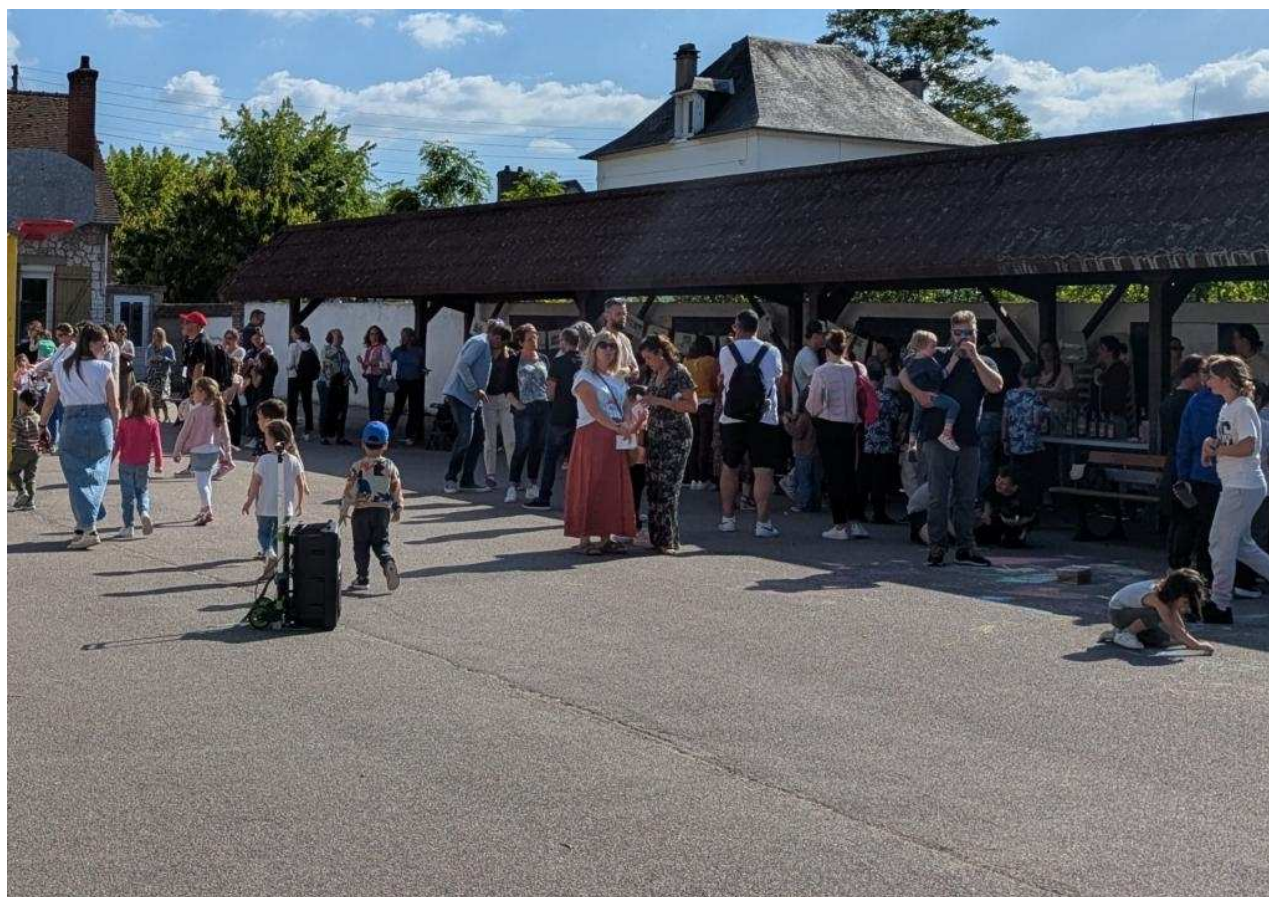
La fête de la santé avait lieu dans la cour de récréation de l'école élémentaire.