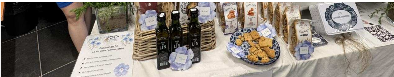
Des élèves fiers de leur stand.