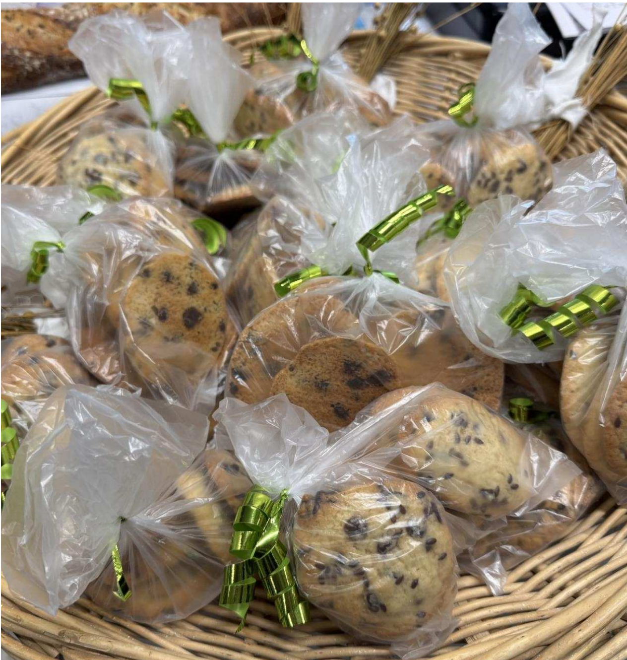
Des cookies aux graines de lin réalisés par les élèves.