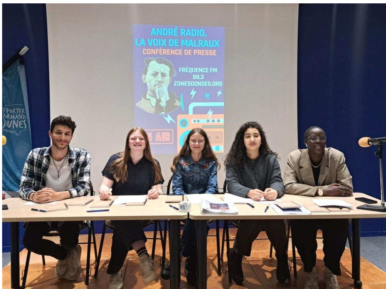
Une aventure radiophonique portée par des élèves engagés