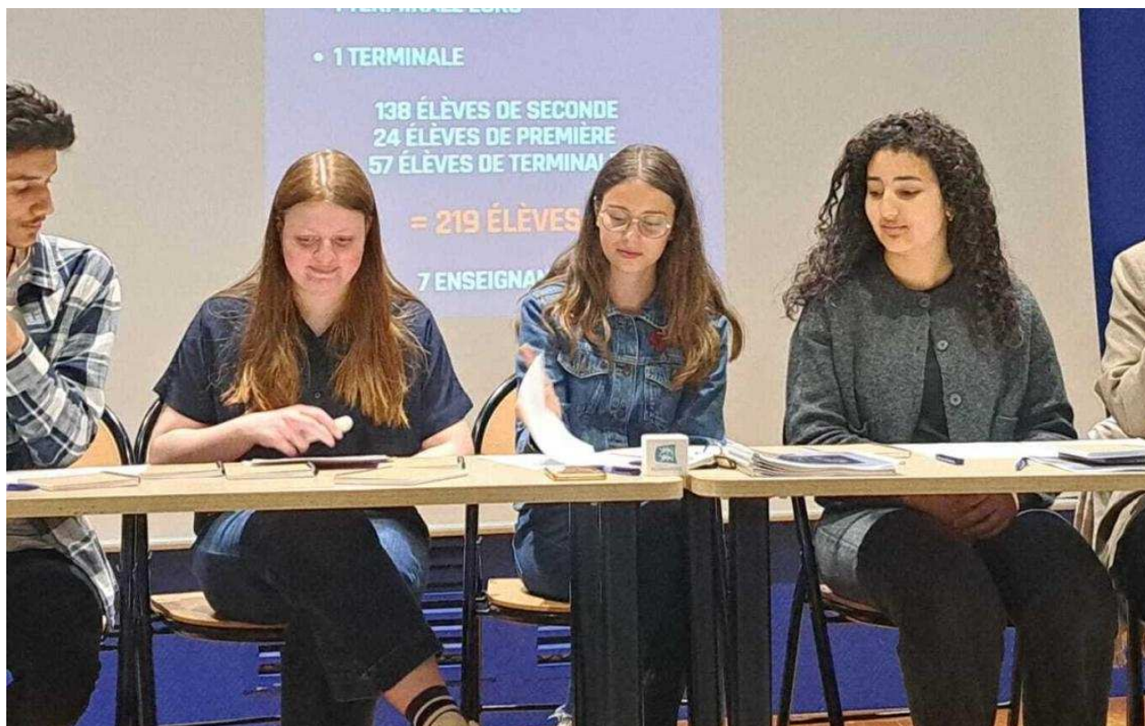
Une aventure radiophonique portée par des élèves engagés