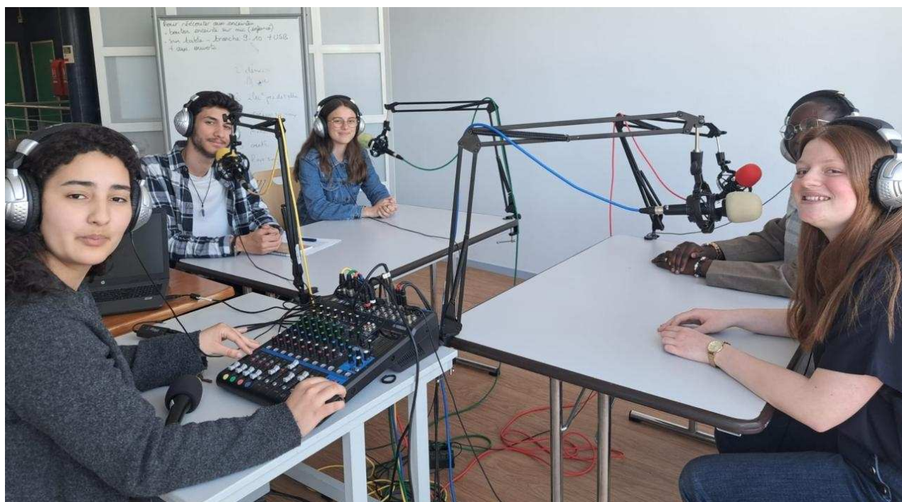
L'émission du 13 mai en préparation dans les locaux de « André Radio », pilotée par les lycéens

Comme le résumait les membres du club Radio : « C'est un énorme travail, mais c'est passionnant. Il faut écrire, s'entraîner à parler, se familiariser avec le matériel... on teste plein de choses et on se dépasse ».