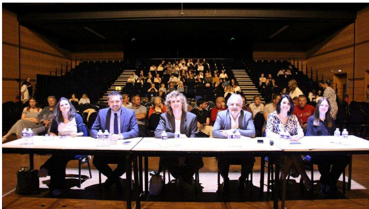
Le jury du concours d'éloquence du lycée de Forges-les-Eaux a sélectionné, sur les 20 élèves, six finalistes