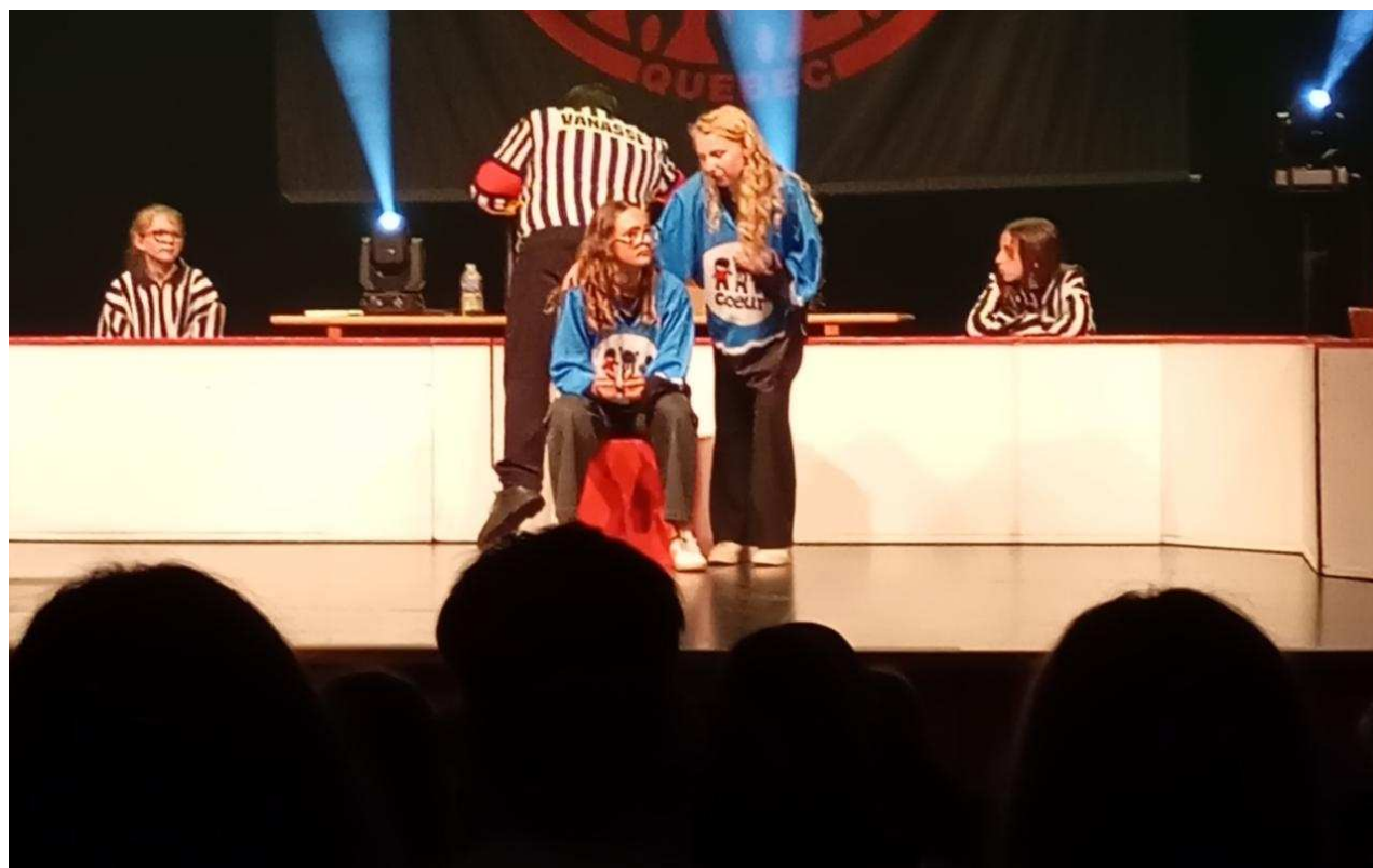
Les jeunes ont relevé le défi haut la main.