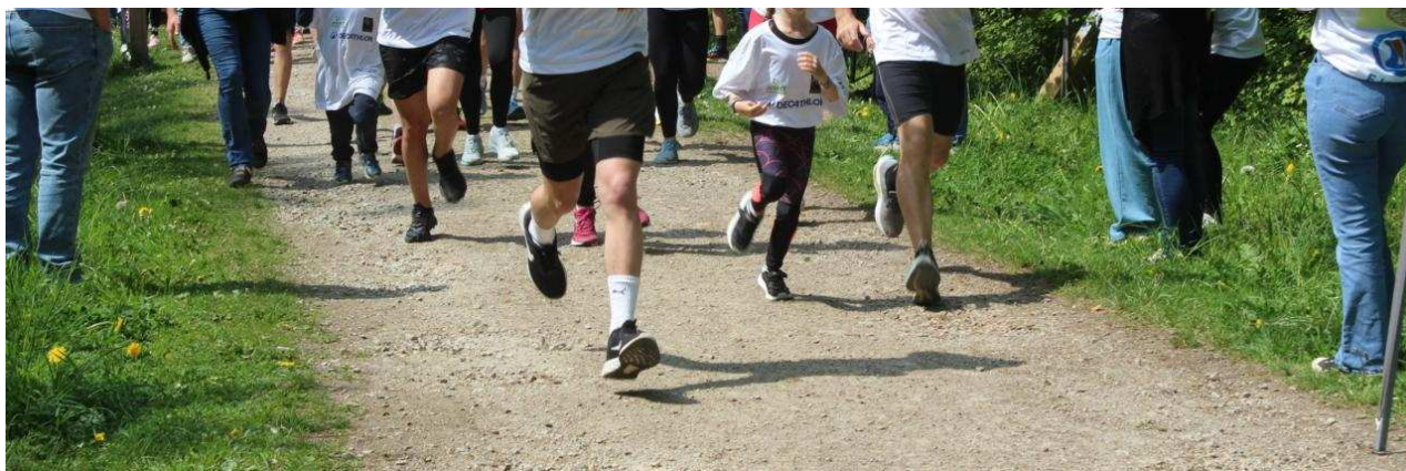
Départ des coureurs.