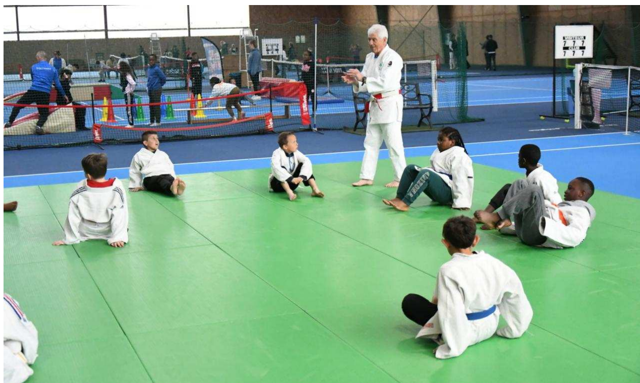
Sports olympiques par excellence, le judo et la gymnastique étaient très prisés par les jeunes écoliers.