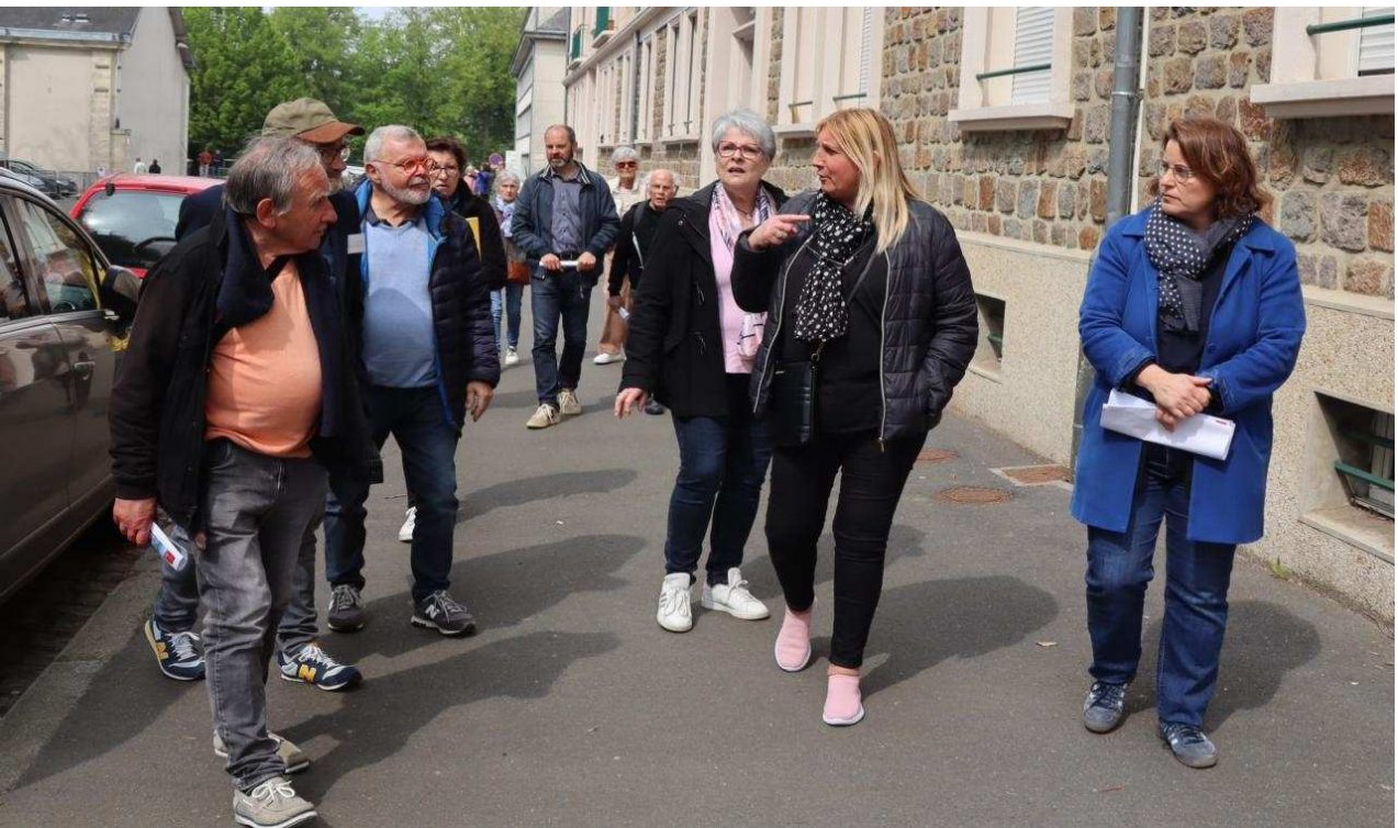
Les habitants ont beaucoup discuté avec les élus, mais également entre eux, au cours de la visite du quartier Jules-Ferry.