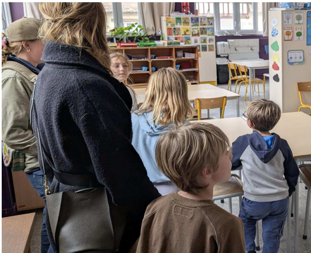
Les portes ouvertes des écoles de Deauville ont eu lieu vendredi.