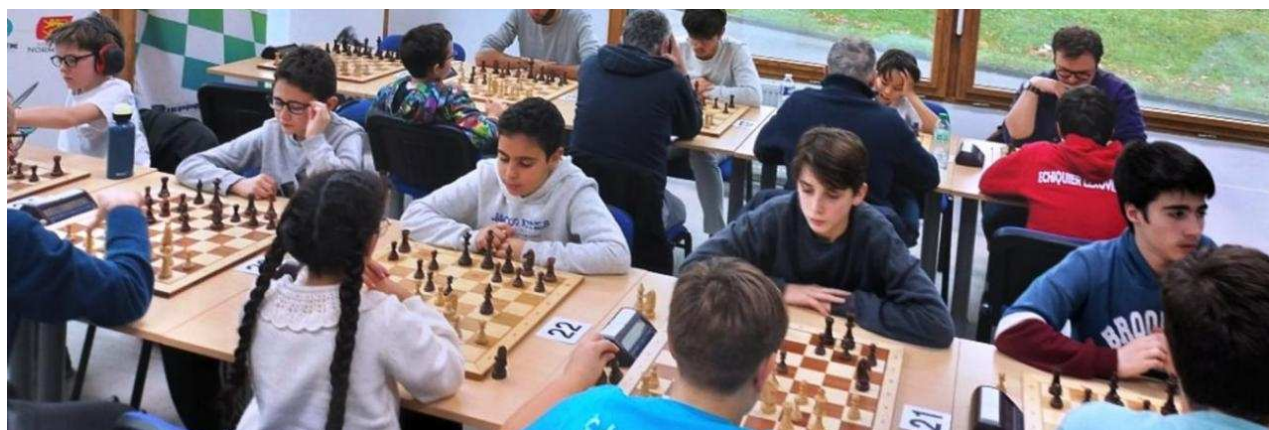
De nombreux élèves aiment jouer aux échecs

« Un club d'échecs existe depuis 2001 au collège », précise le chef d'établissement dans lequel « le club dieppois intervient déjà, mais aujourd'hui, nous avons obtenu l'accord de l'académie de Rouen pour ouvrir à compter de la prochaine rentrée de septembre 2025 une section sportive scolaire dédiée aux échecs. »