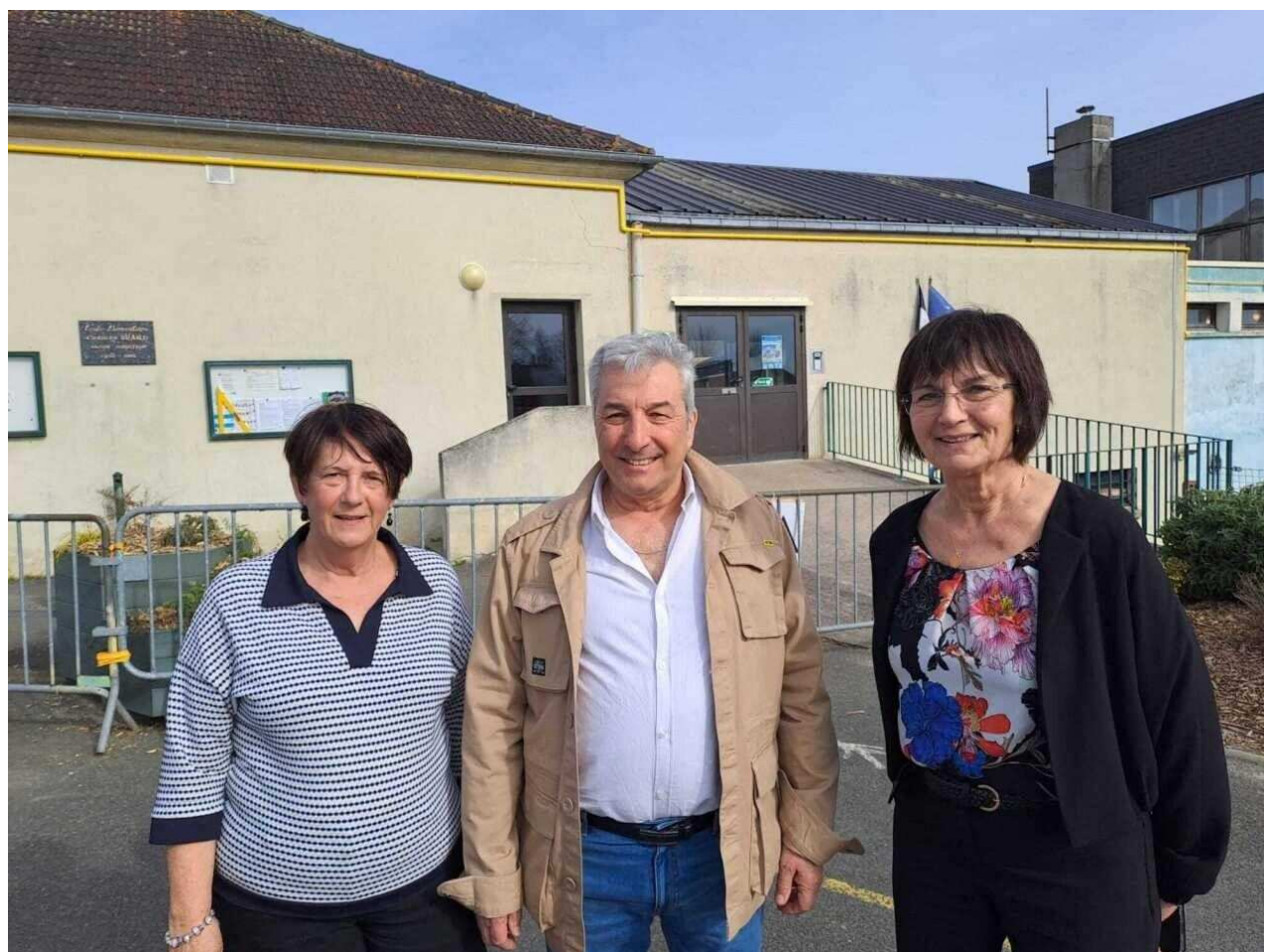
Ecole St Martin de Fontenay travaux