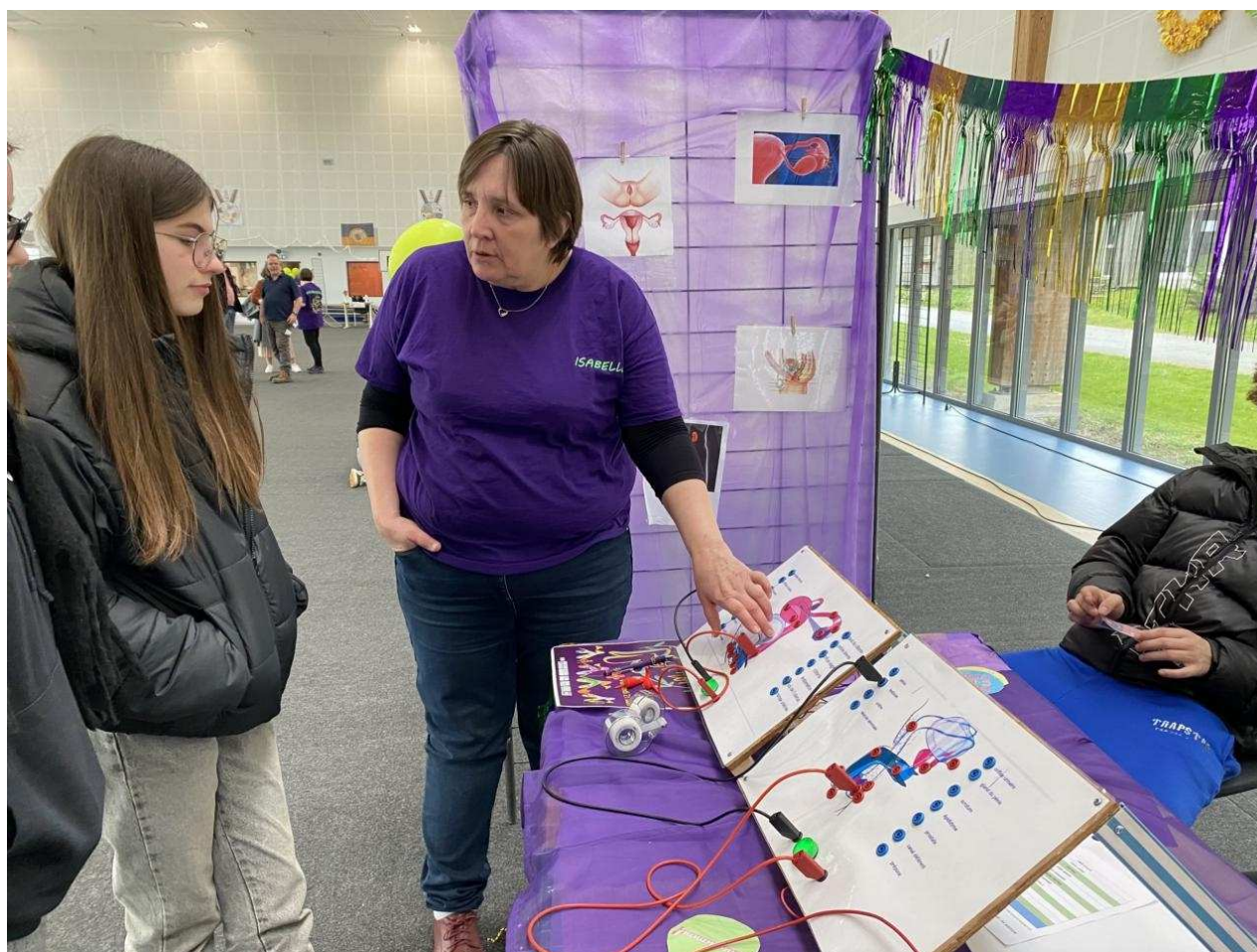
Un quiz sur l'anatomie de genre inspiré du jeu Dr Maboule.

Dragée, les deux chevilles ouvrières, s'y sont rendues pour promouvoir le projet. Fort de son succès, le forum connaîtra une troisième édition en 2026, avec pour ambition de s'inscrire dans la durée.