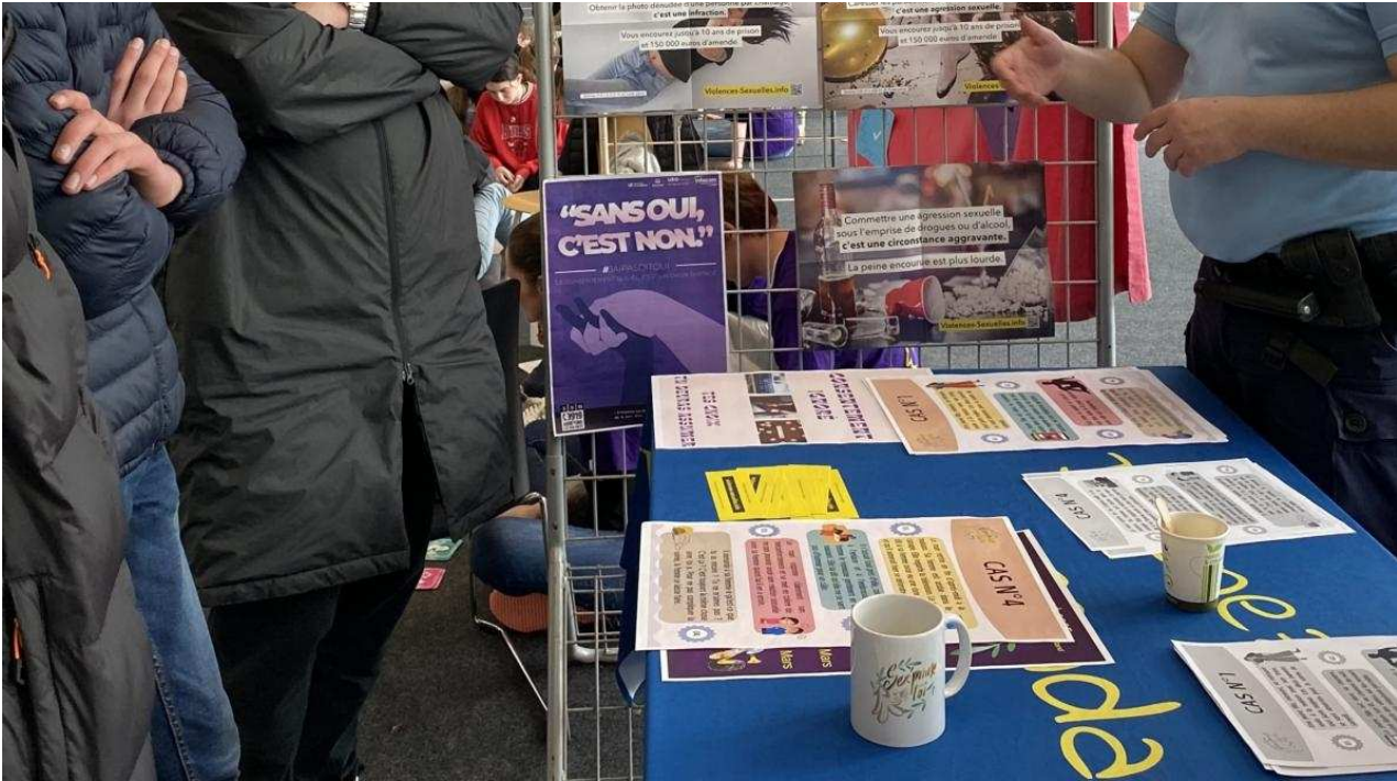
La gendarmerie présente au forum pour aborder la question du consentement et de la loi MP