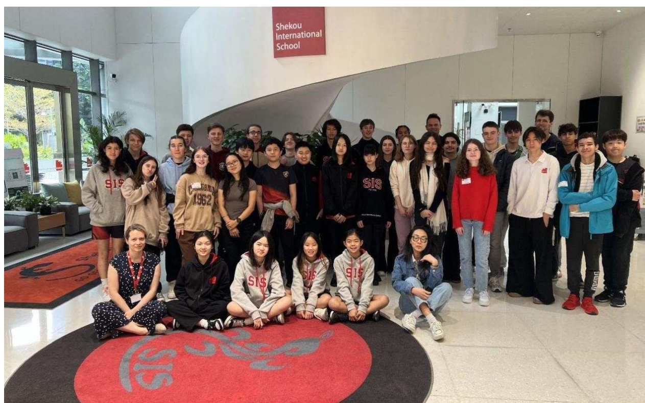
Les élèves sont arrivés en Chine