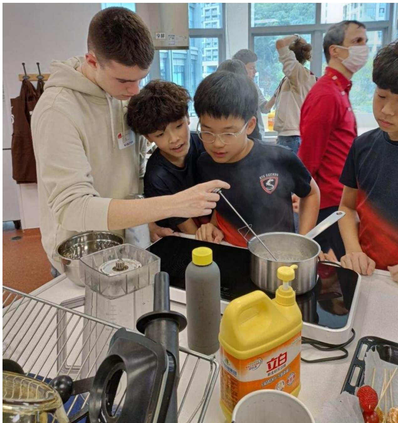
atelier cuisine entre deux culture