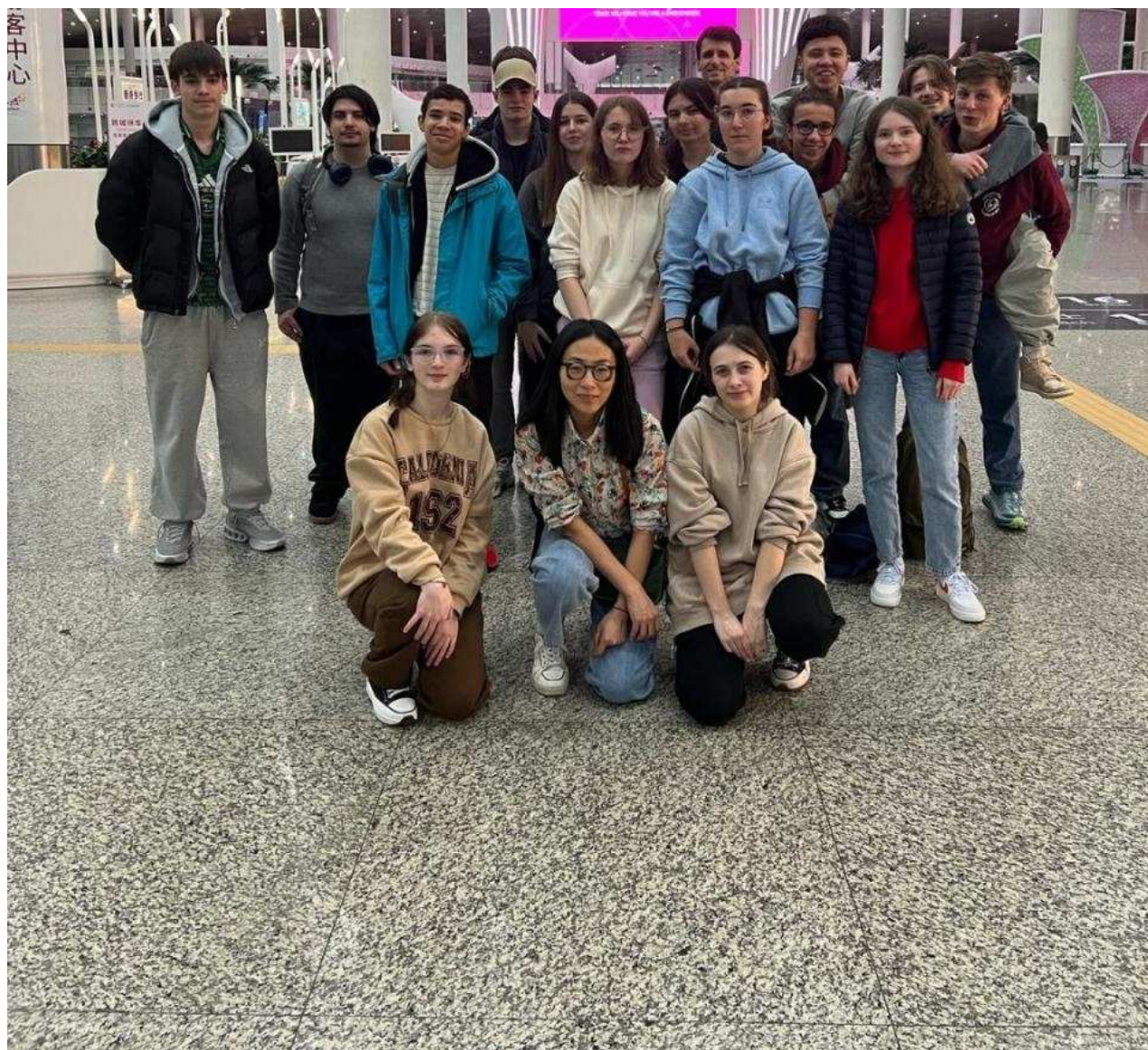
Un voyage en Chine