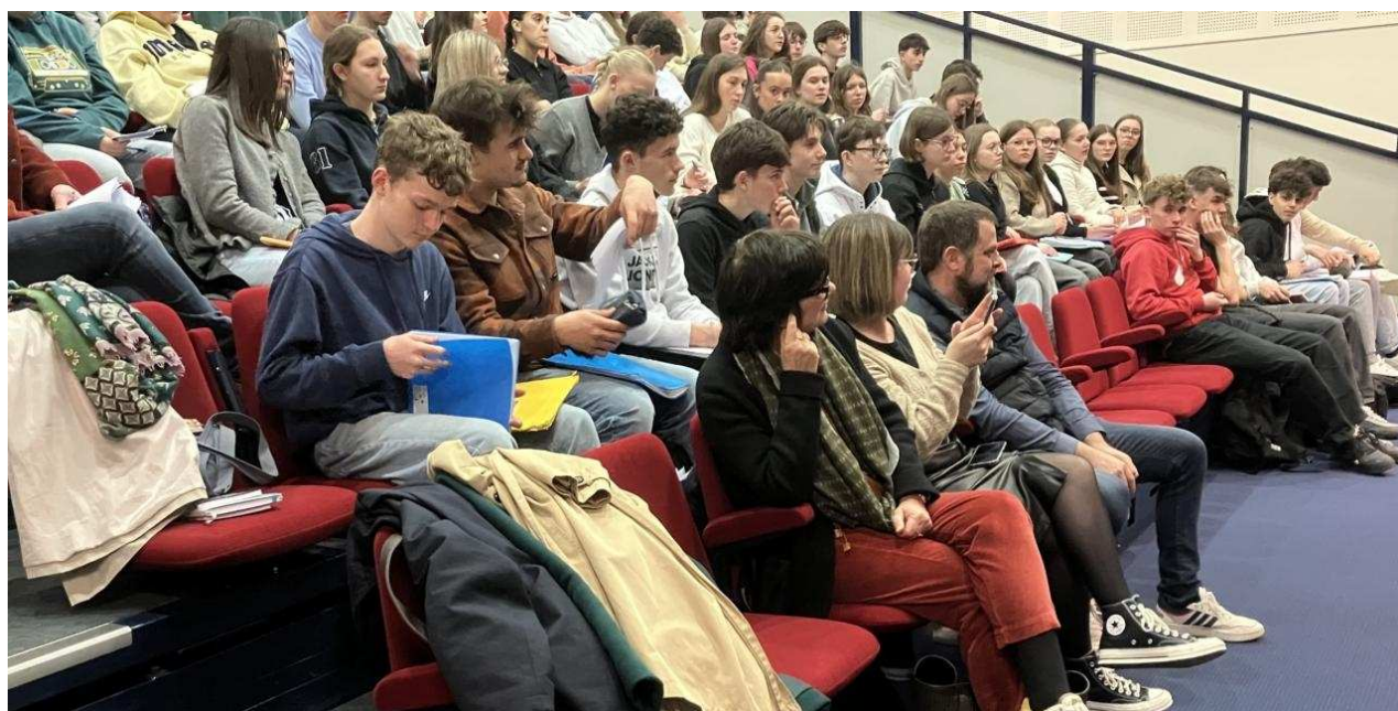
Les premières du lycée Mézeray.