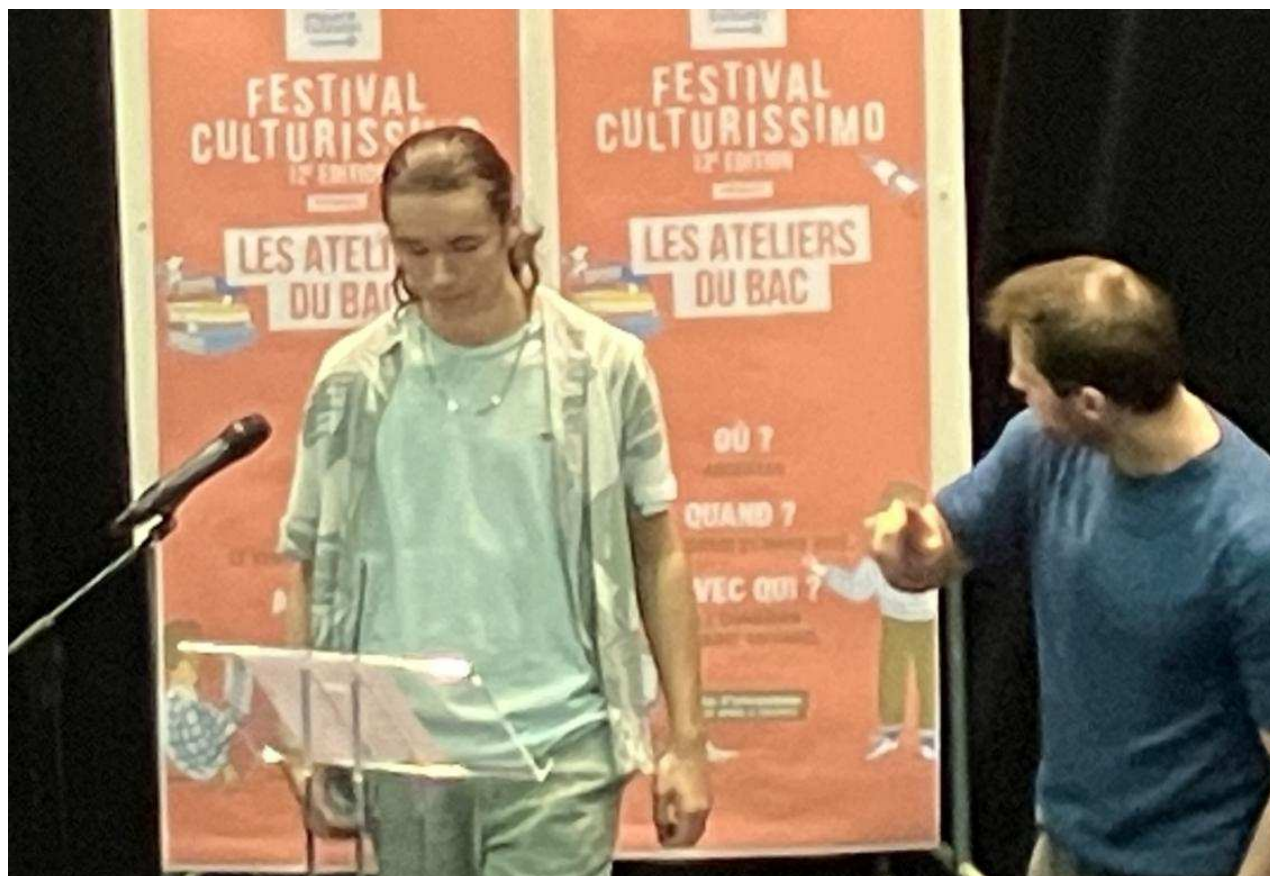
Mise en application du coach comédien