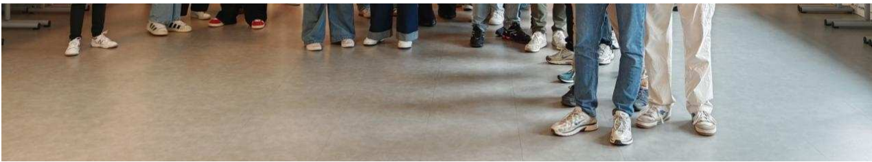
Les lycéens ont découvert les danses irlandaises. Jérôme Buresi