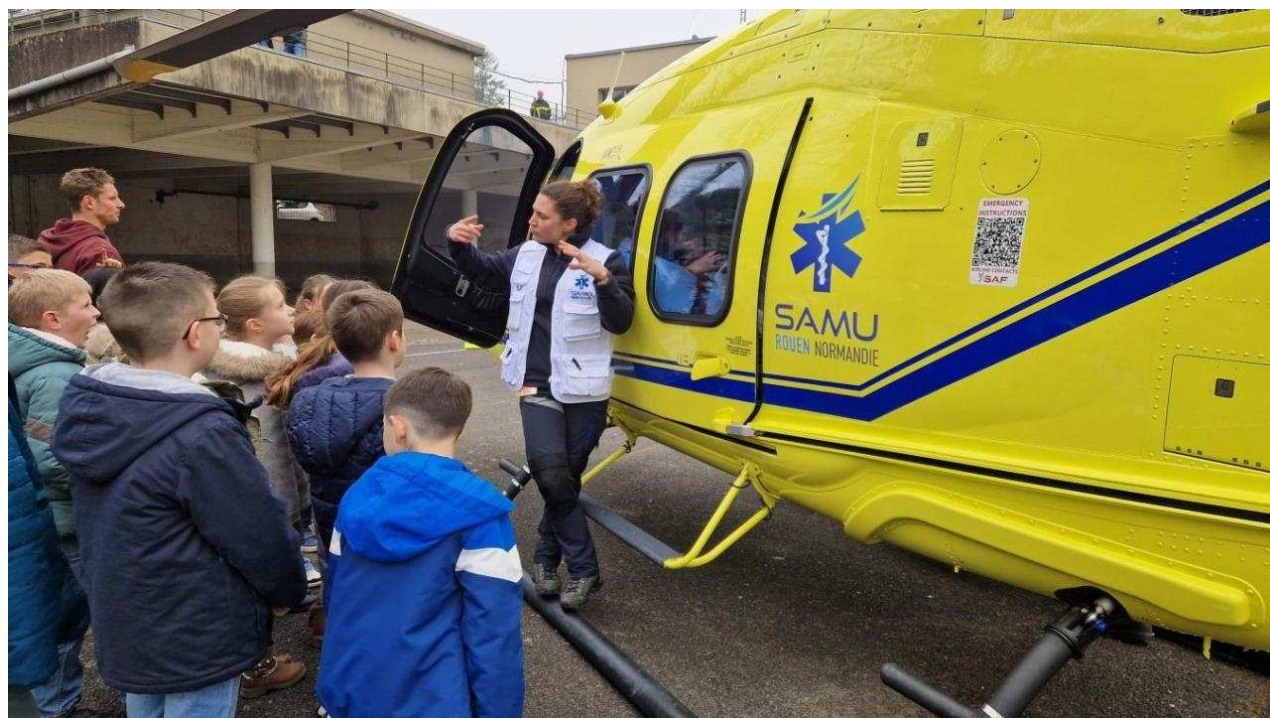
130 écoliers ont pu échanger avec les secouristes