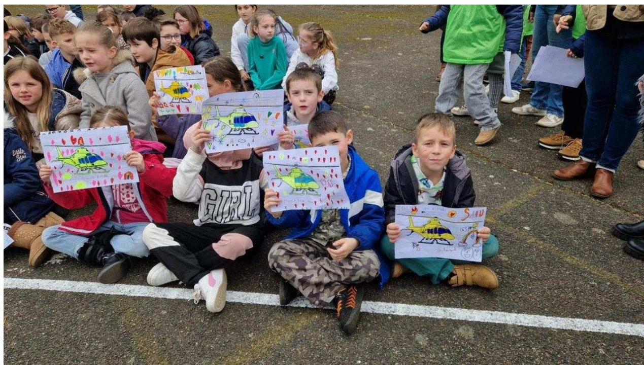
Des élèves avaient préparé des dessins de l'hélicoptère qui ont été remis aux secouristes