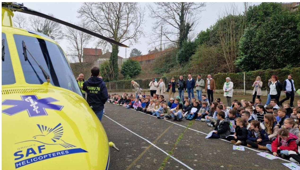
130 écoliers ont pu échanger avec les secouristes

d'intervention, une petite mise en scène a été présentée : un homme appelle le 15 car son copain de 50 ans a de fortes douleurs à la poitrine. De là interviennent les sapeurs-pompiers, puis le Samu, avant l'évacuation de l'homme vers le CHU de Rouen en hélicoptère « Viking ». « On vole à 280 km/h. On met quinze minutes pour rejoindre Rouen », détaille le pilote.