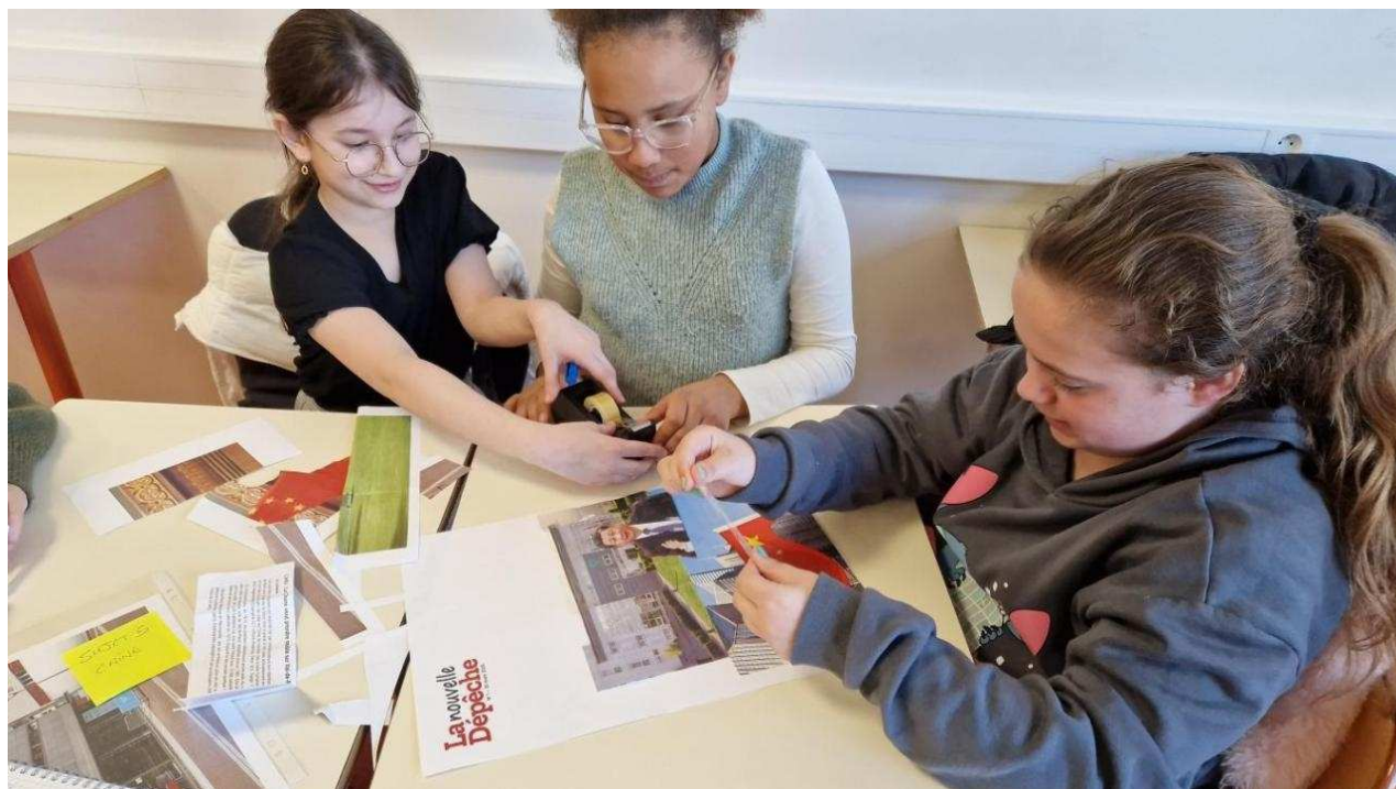
Les élèves d'une classe de CM2 de l'école des Dominos à Val-de-Reuil ont dû créer différentes Unes lors d'un atelier

Perfectionnistes, certains coupent et recommencent à se filmer. L'heure du premier atelier touche bientôt à sa fin. On projette les vidéos « TokTok » sur un mur grâce au rétroprojecteur.