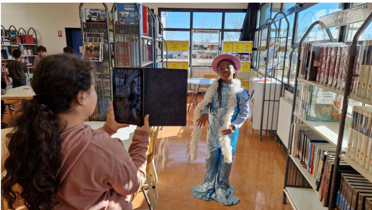
Shynaka a choisi de jouer une clubbeuse

Le sourire aux lèvres, les petits Rolivalois se dirigent vers les déguisements. « Tu fais le maire et je te filme ? » Très rapidement, tablette en mains, les petits groupes commencent à enregistrer. C'est parti pour moins d'une minute de scène. « Dans le ciel, j'ai vu une météorite ! Je ne sais pas trop ce que c'était... Ça ressemblait à une boule de feu. »