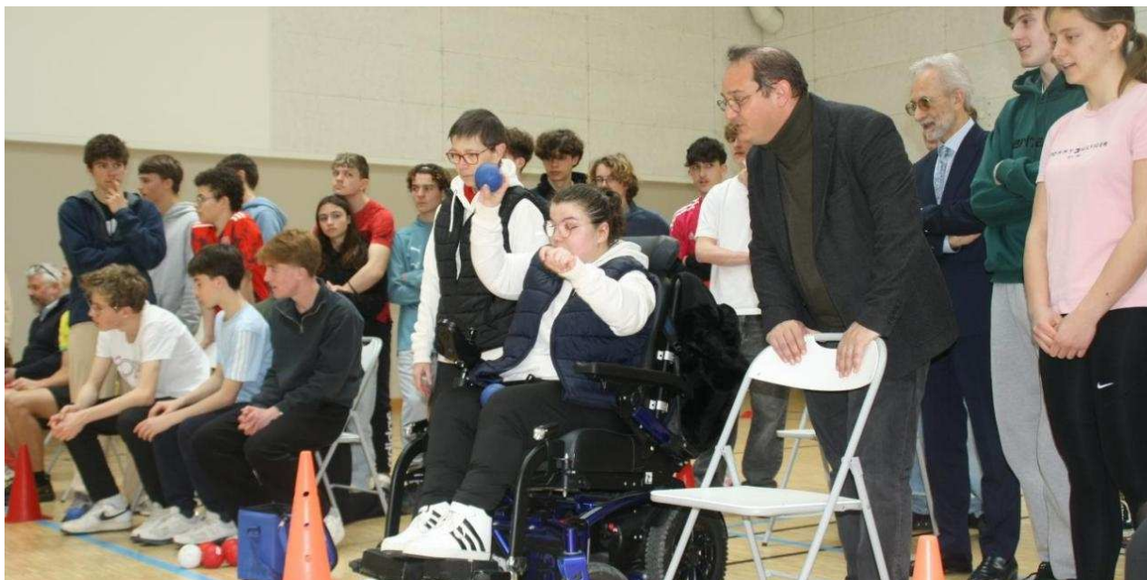
Aurélie Aubert, championne paralympique de boccia, se mesure aux lycéens