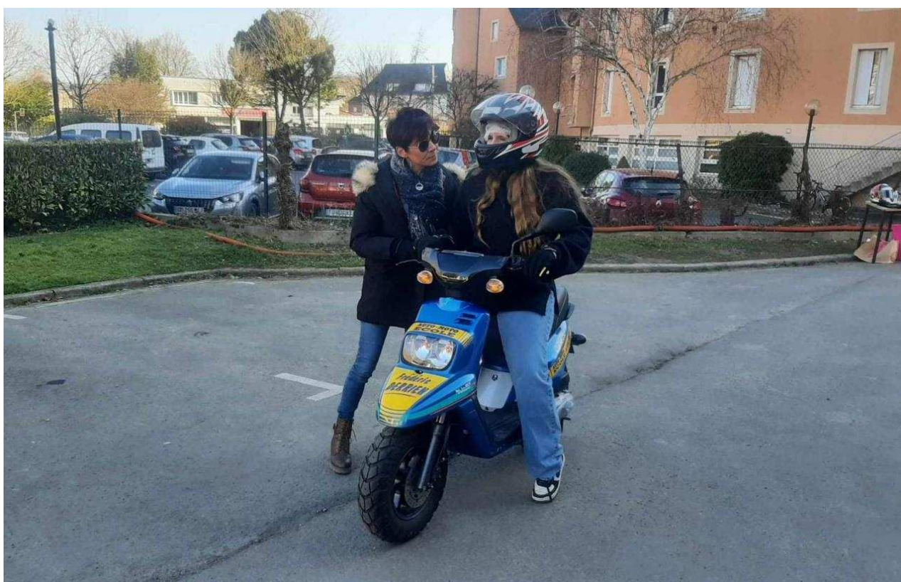
L'auto-école Derrien a proposé des initiations de scooter.