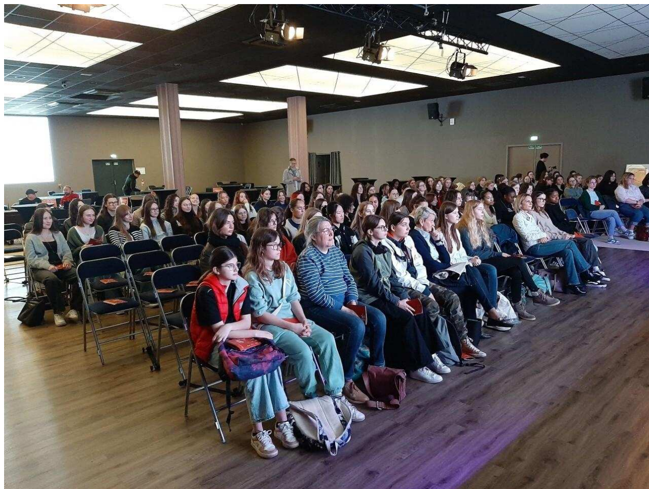
Six lycées de l'Eure ont participé au salon.

Jeudi 20 mars dès 9 h 30, les élèves de 2nde, 1re et terminale de six lycées de l'Eure ( Louviers , Évreux , Vernon , Bernay , Gisors et Verneuil ), se sont réunies chez Toy événements à Louviers pour une journée de rencontres, tables rondes, ateliers et échanges sur la place des femmes dans les entreprises industrielles.